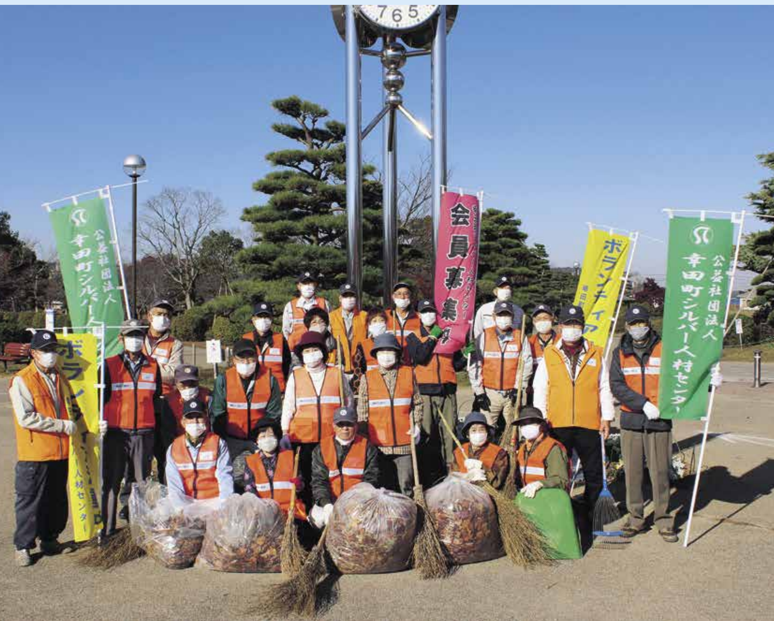
表紙の写真は、清掃ボランティア活動の写真(場所は幸田中央公園)