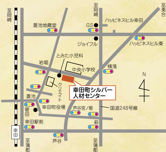
幸田町シルバー人材センター位置図