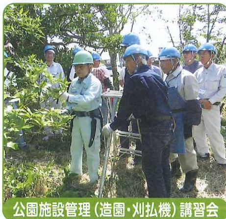
公園施設管理(造園・刈払機)講習会