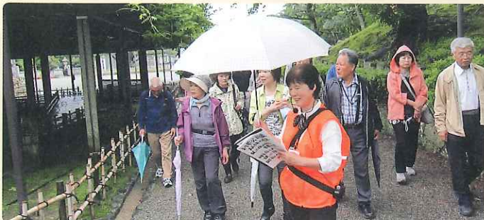
歴史ある芦城公園の史跡を散策

6月6日、小松観光ボランティアガイドの会の方から詳しい説明を聞きながら楽しい散策をしました。