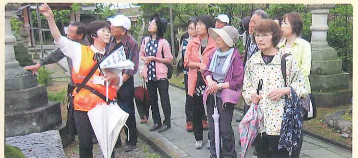
新たに浮島となった小松天満宮を散策