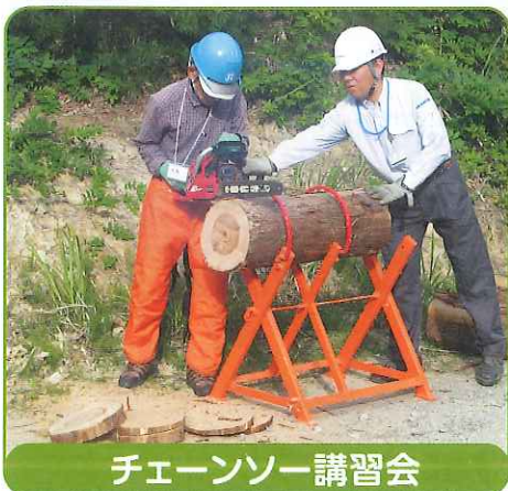
チェーンソー講習会