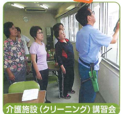
介護施設(クリーニング)講習会