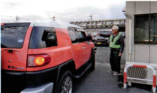
駐車場に入る車の運転手にカードを渡す入江会員

シルバーらしい気遣いと知恵を4人の会員さんの姿に教わった訪問でした。 【T&I】