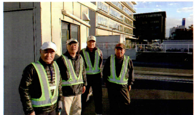
左から板場会員、平野会員、入江会員、浅見会員