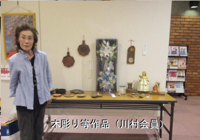
木彫り等作品 (川村会員)