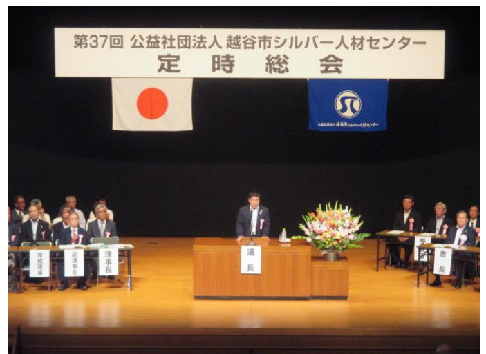
定時総会会場風景