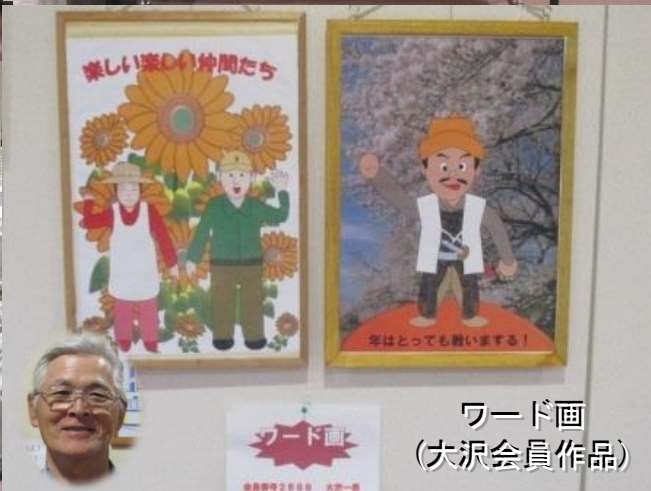
ワード画 (大沢会員作品)