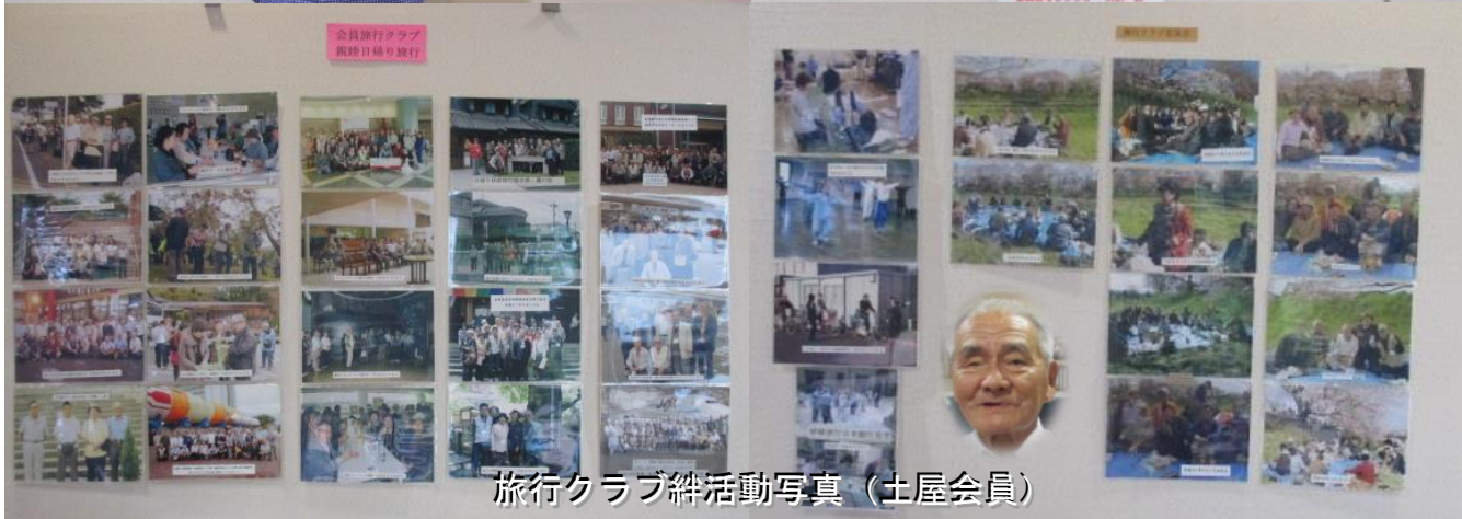
旅行クラブ絆活動写真 (土屋会員)