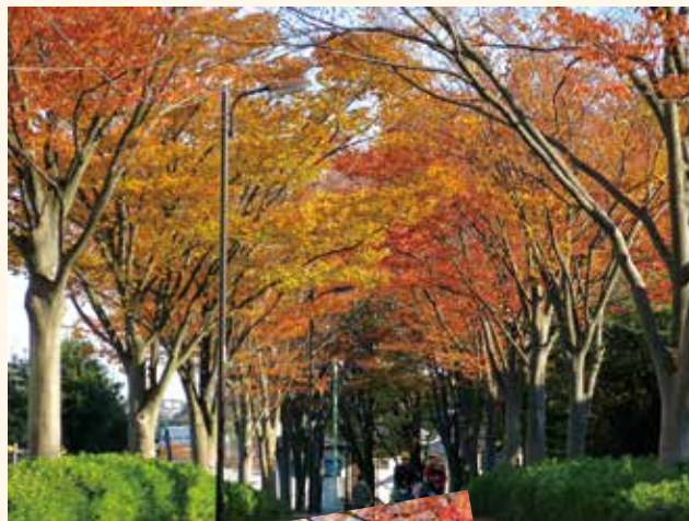
尾根緑道の長く続くケヤキ並木