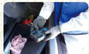
バッテリーチェック