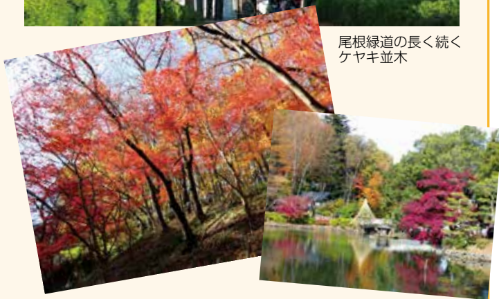
薬師池公園、斜面のモミジ