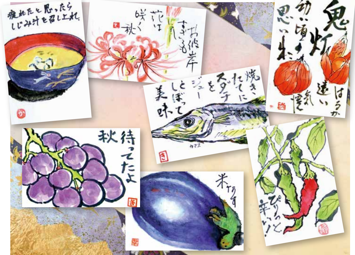
作品：会員有志（共済会—絵友会）わくわくプラザ町田作品展より