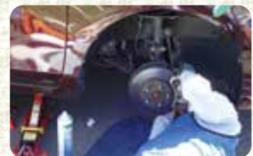
ディスクパッド確認