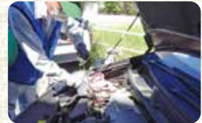
エンジンオイル確認

最後に、オーナーさんに感想をお聞きしたところ、「2回目のユーザー車検だが、前回も含め、自宅でできることと、仕事が丁寧で安心していられる。また、非常に安く済むのが魅力」とおっしゃっていました。