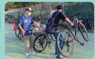
J2リーグ FC町田ゼルビア戦に参加、入場ゲートや駐輪場で活動