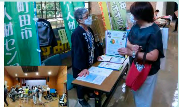
9月4日(日)「南地区福祉フェア」開催、当センターも出展、PR活動を行いました