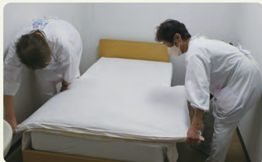
医師が使用したベッドの寝具交換作業