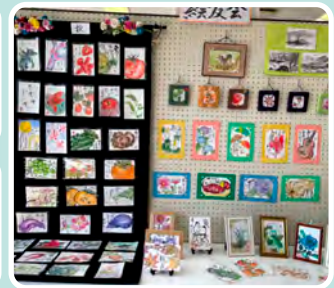
9月30日(金)から「わくわく作品展」開催 共助会からも力作を展示