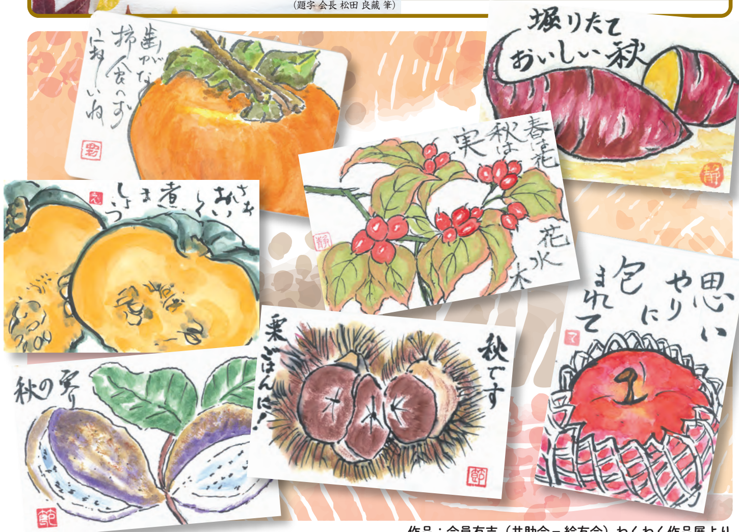
作品：会員有志（共助会－絵友会）わくわく作品展より