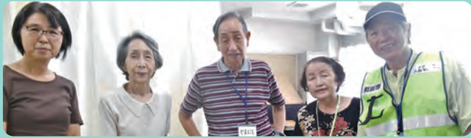
9月17日(土)に南第三小学校にて独楽まわし、あやとりなど、昔あそびを教えました