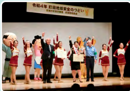
10月10日(月)「令和4年 町田地域安全のつどい」が開催されました