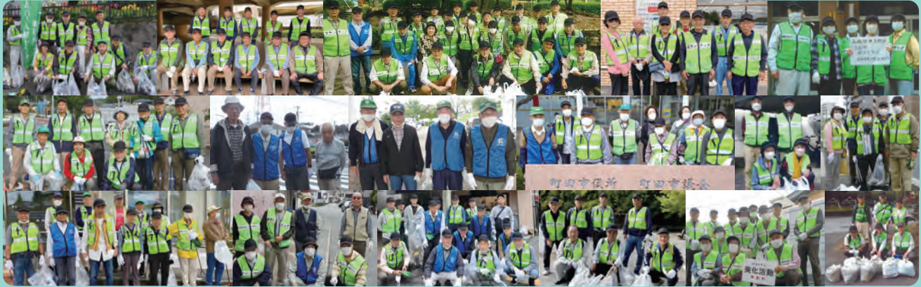
10月15日(土)市内一斉美化清掃開催、76班350名が参加しました。お疲れさまでした一部を掲載します。1月号で特集予定