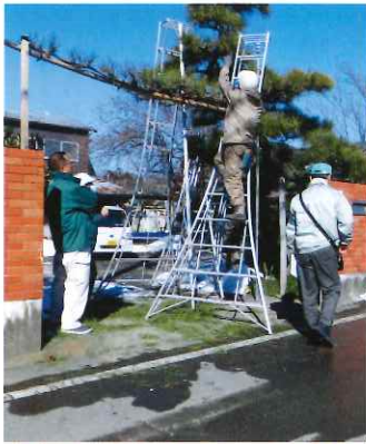
1/26 安全パトロールの様子

安全適正就業委員会の活動について 安全・適正就業委員会では就業時の事故撲滅を目的とし、年三回の安全パトロールの実施と事故発生の原因追及・再発防止について年四回の委員会を開催しています。シルバーの就業にそぐわない受注は受けない、また受注時には、就業内容を十分に把握し「現場の下見・危険箇所の確認」をするという心構えが大切です。 平成二十八年一月に第三回の、安全パトロールを実施しました。植木の作業では保護具を着用し、