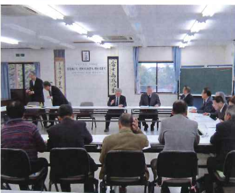
佐倉市シルバー人材センターにて研修

ました。その途中、花嫁さん、花婿さんに出会い、皆さんが祝福の拍手で見送っていました。最終見学地へ向かう途中、長野県内で天守閣を構える城の一つである高島城を左に見て、信州味噌蔵の丸高蔵へ。当蔵では温泉を利用して味噌作りをしていると説明を受け、商品の「鯖の味噌缶」を購入していました。最終地を四十分程遅れで後にしましたが、旅の途中、多少のトラブルはあったものの、怪我もなく元気で終了できましたのも皆様の御協力の賜物と、担当いたしました伊藤共々、感謝申し上げます、ご報告と致します。