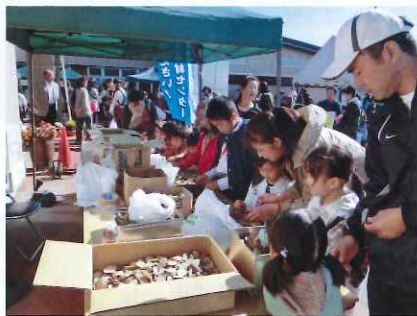
子ども木切れ木工