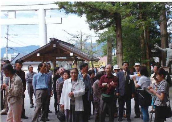
諏訪大社御柱の前にて

高原の爽やかな風を感じながらいと、雲の間より恥ずかしそうに富士山が顔を出してくれました。霧ヶ峰高原では、周辺の散歩とお買いもの等楽しんでおりました。諏訪湖へ降り、なんととっても旅の楽しみでもある昼食は、上諏訪の「おぎのや」でいただきました。食後は沢山のお土産を買い次の目的地へと向かいました。諏訪大社「上社」では、案内の方に説明をして頂きながら参拝し