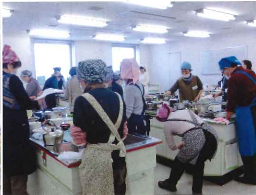
調理アシスタント講習