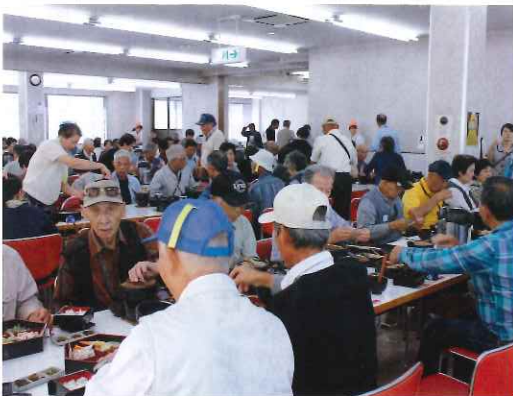
おぎのやにて 昼食

平成二十七年度の親睦旅行は、諏訪湖方面への旅となりました。九月十二日（土曜日）は天気に恵まれ八十五名の参加を戴き、一号車は富士見町から、二号車は大胡町から出発し、前橋駅で合流し、七時三十分前橋駅を出発、前橋ICより関越道、上信越道、佐久より白樺湖へ向かい、霧ヶ峰高原道路（ビーナスライン）を走り、霧ヶ峰高原にある旅の駅レストラン・ビーナスへ向かいました。