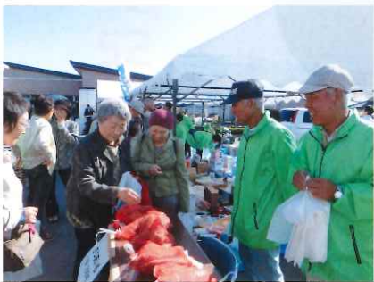
農園同好会、野菜販売