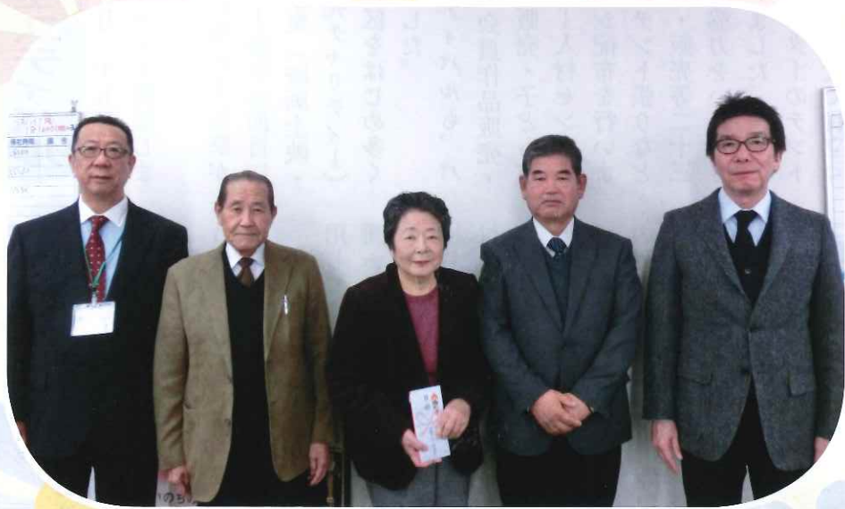
バザー収益金を前橋市社会福祉協議会に寄付 関連記事P2

編集・発行 公益社団法人 前橋市シルバー人材センター 前橋市元総社町2丁目20番地6 電話 254-5022 FAX 254-5444