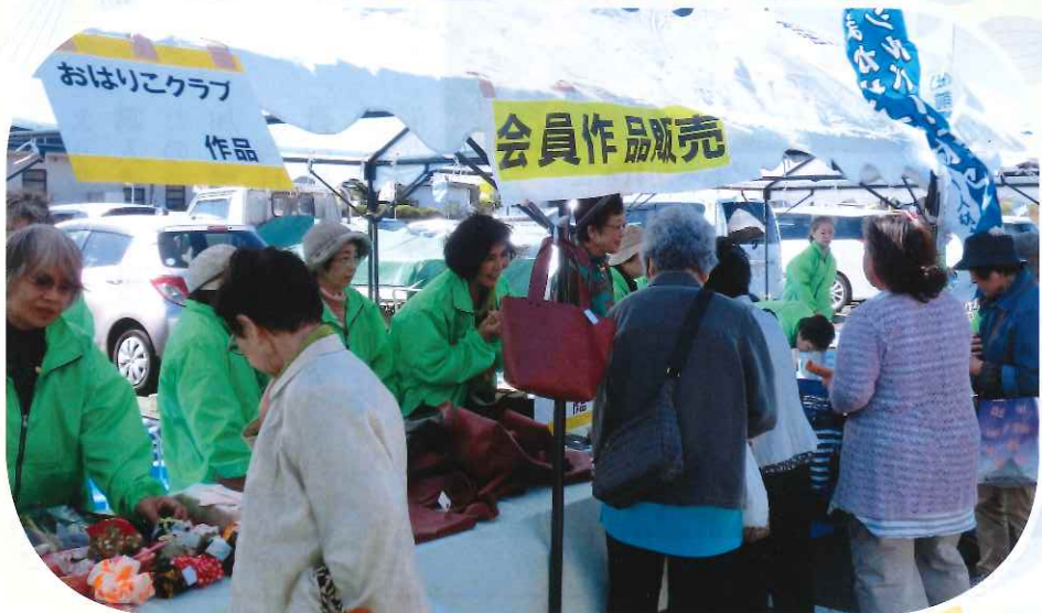
大盛況 シルバーフェスティバル 関連記事P2