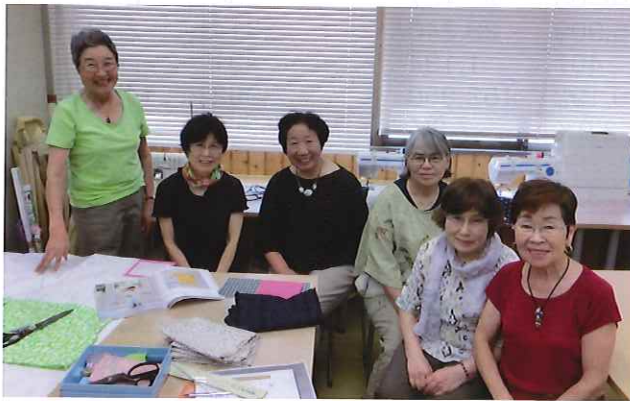
紬の会のみなさん

芸能ボランティアクラブから時々、デイサービス、いきいきサロン等ボランティアに参加していますが、持参するお手玉作りもします。和気あいあい楽しんで一〇〇個、二〇〇個と作っています。