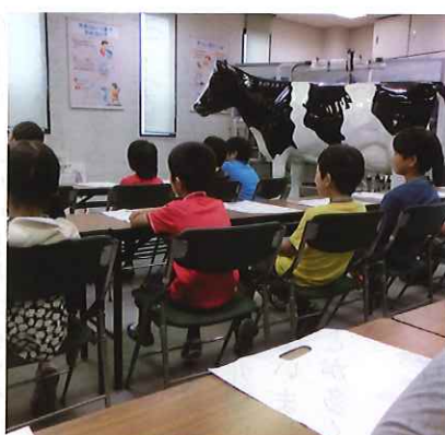
牛乳工場見学の様子

す」など、全員から「楽しかった」という意見をいただきました。また、「たくさんの友達ができてうれしかった」という意見も多く、子供たちの社会性、協調性を育む機会にもなったようです。「夏休みみどりの教室」は毎年好評をいただいています。来年もより充実した教室が開催できるよう研鑽していきます。