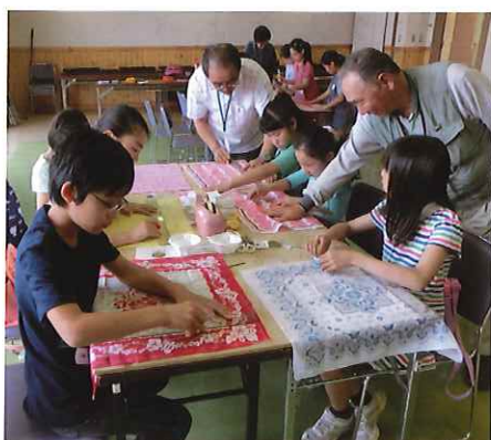
「土曜日みどりの教室で開催したハンカチブローチ」

最終日にとったアンケートには、「みどりの教室に行くのがとっても楽しみになっていたので、終わってしまうとちょっと悲しい」「五日間でいろんなことを学べた」「来年もみどりの教室に來たいで