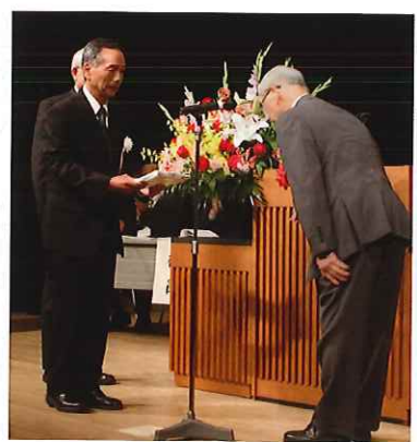
安全標語の表彰の様子

就業中の事故について 就業中や就業途上に事故については、「団体傷害保険」賠償責任保険にて給付金をお支払しておりますので、事故に遭った場合は、すぐにセンター事務局にご連絡下さい。なお、お客様から直接依頼があった仕事を事前に事務局へ報告しないまま就業した場合は保険の適用になりませんのでご注意ください。(草刈機使用時の賠償石飛事故は免責二万円の負担あり)