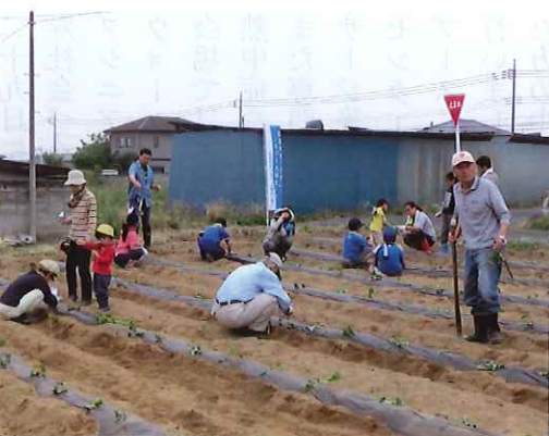
農業体験（サツマイモ栽培）