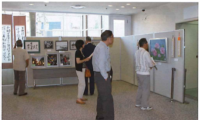
会員作品展示会場