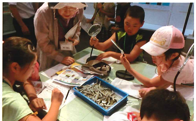
絹の里で蚕の生態を学ぶ