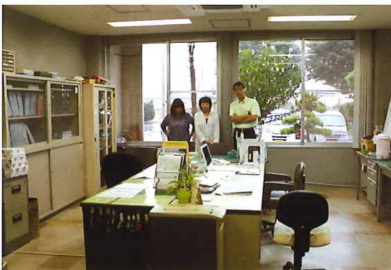
大胡事務所 岸所長以下3名

市町村の合併に伴い、前橋市、大胡・宮城・粕川のセンターが統合してから今年で十年になります。元総社の事務所を本部とし、大胡事務所・富士見事務所を構え、市内全域に、より良いサービスが提供できるよう努めてまいります。 今後ともよろしくお願ひいたします。