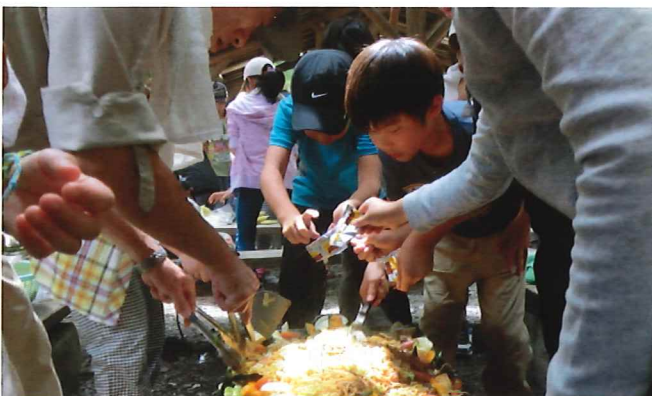
赤城ふれあいの里でバーベキューを楽しむ子供達

今年度も七月二十八日から八月一日までの五日間、夏休みみどりの教室を実施しました。今回も、お申し込みを多数頂き、当選された小学4年生～6年生三十名とシルバー人材センターの会員で、夏休みの楽しい思い出を作りました。高齢者との交流の中で、物を作る創造力・仲間との協調性などを身に着け、終了後のアンケートでは「また参加してみたい」「他校の生徒と友達になれて楽しかった」などのご意見も頂きました。 今年度は、新たに、赤城ふれあいの森でバーベキューや、日本絹の里見学等も行いました。バーベキューでは、子供達が率先して焼きそばを作り、みんなで美味しく食べました。また、絹の里では普段触れることのない蚕に触れ貴重な体験をしました。どの子供も蚕の生態に興味津々でした。今後も今年の体験を生かした内容で、実施できたらと考えております。