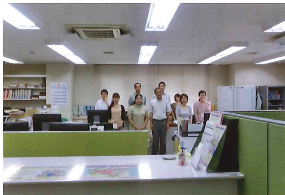
本部（元総社町） 堀事務局長以下9名