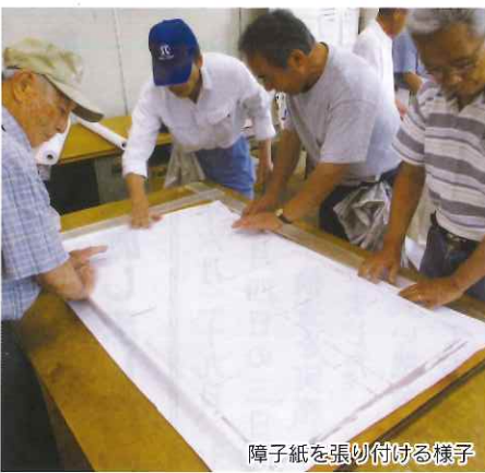
障子紙を張り付けの様子