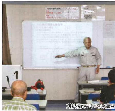
刈払機についての講習

安全衛生教育を受講させること」と規定されています。前橋市シルバー人材センターも同様に、草刈作業は、取扱作業安全衛生講習を受講されている方にしかお仕事を御願いしません。来年度も開催予定ですので、草刈作業希望で未受講の方は、必ず受講してください。