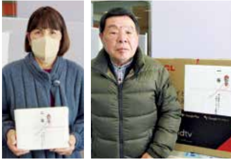
お楽しみ抽選会 2等