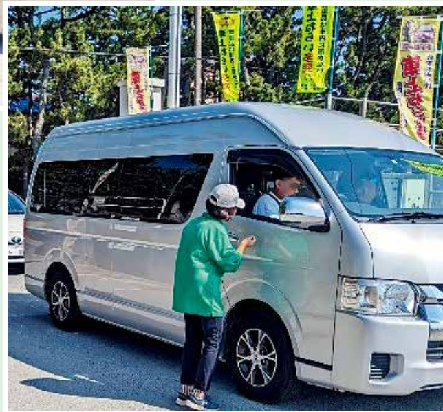
さがらサンビーチ