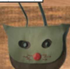
小銭入れ かばんのアクセサリ にもなります。 800円