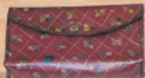
小物入れ、通帳も入ります。 5,000円