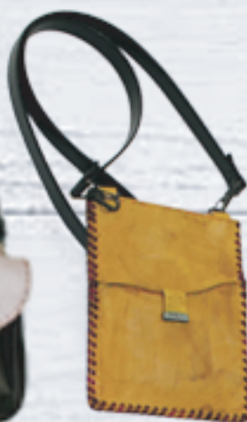
スマホ入れ、便利です。 5,000円