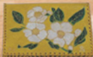
お薬手帳・診察カード入れなどに 10,000円