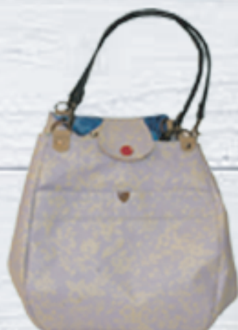
使いかってがいですよ。 5,000円