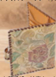
お薬手帳・診察カード 入れなどに 8,000円