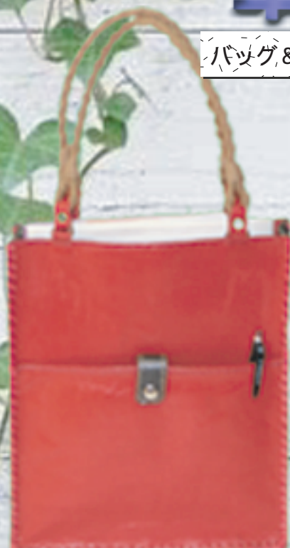
トートバック A4サイズが入ります。 寸法 25センチ×29センチ×7センチ 10,000~ 20,000円