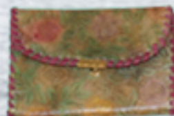
カード入れケース 4,500円~