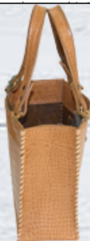
トートバック(小) 8,000円~