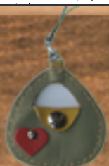
小銭入れ かばんのアクセサリ にもなります。 500円