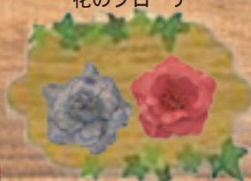
各 = 1,000円