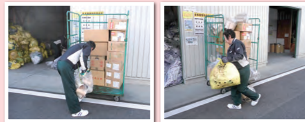
(東和薬品㈱ 岡山工場 屋外軽作業)