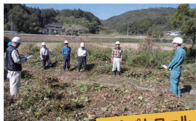
平成29年度通常総会