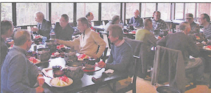
昼食会：信楽駅前「一水庵」にて