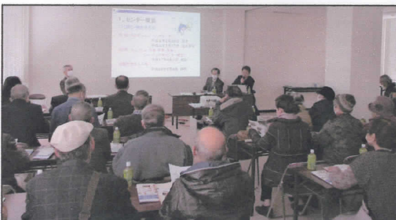
甲賀市シルバー人材センターでの視察研修の風景