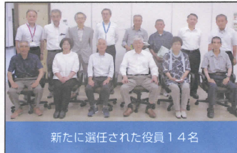
新たに選任された役員14名

※退任された役員さんには、お世話になり、ありがとうございました。 お疲れ様でした。