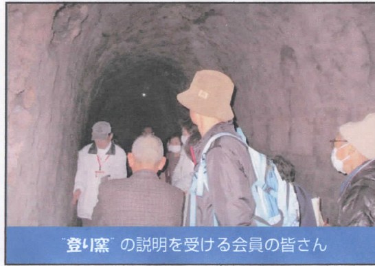
「登り窯」の説明を受ける会員の皆さん

※今年度も、会員研修で新たな知識の習得と会員相互の親睦を図るため、令和3年2月に「日帰り研修会」の開催を予定しています。多数の会員の参加をお待ちしています。