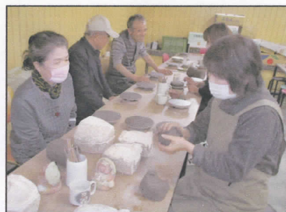
陶芸村にての“陶芸体験教室”