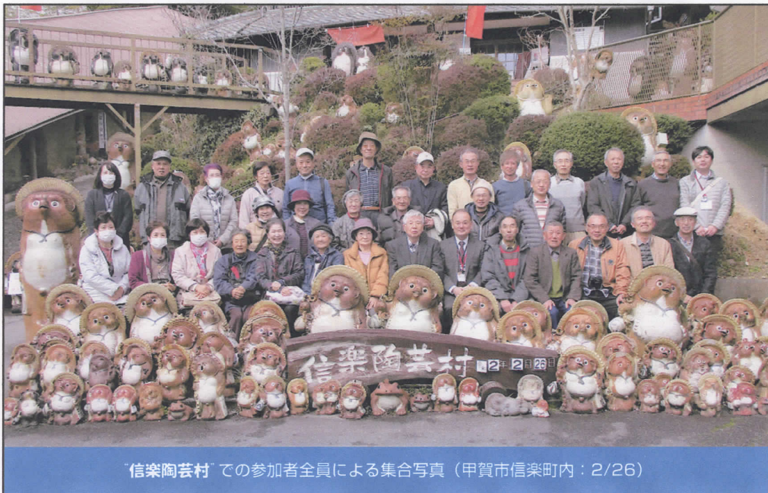
「信楽陶芸村」での参加者全員による集合写真（甲賀市信楽町内：2/26）