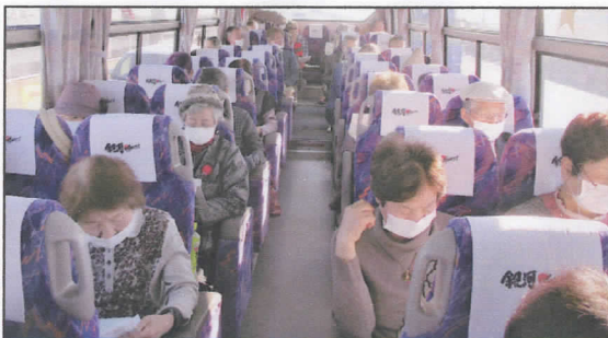
車内での会員研修；行きバスにて

日 時 令和2年2月26日(水) 午前8時から午後6時まで 場 所 滋賀県甲賀市シルバー人材センター、NHK 朝の連ドラ“スカーレット” の舞台となった甲賀市信楽町の信楽伝統産業会館や信楽陶芸村など 参加者 33名(うち、事務局3名随行)