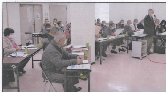
甲賀市シルバー人材センターでの日比会長挨拶