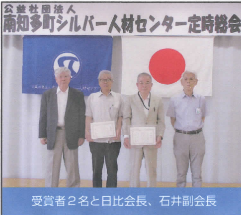
受賞者2名と日比会長、石井副会長