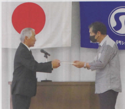
会長から表彰状が手渡されました

日 時▶令和5年6月12日(月) 午後2時から 場 所▶南知多JA会館大会議室 出席状況▶本人出席 36名 委任状及び書面表決62名