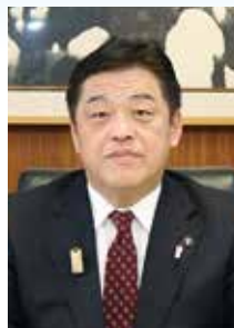
南魚沼市長 林 茂男