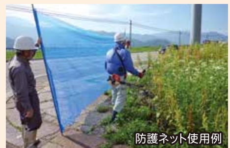
防護ネット使用例