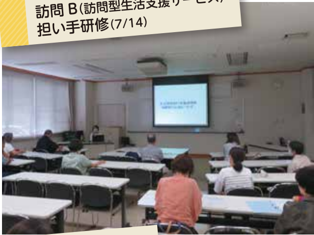
訪問 B (訪問型生活支援サービス) 担い手研修 (7/14)