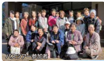
バスツアー参加者