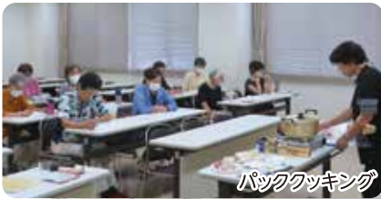
バッククッキング

今年度は4月 健康体操教室&ランチ会。9月 防災教室&バッククッキング。10月 魚沼探訪バスツアーの3事業と地区ごとに懇親会を実施。各事業とも美味しい食事をいただきながら仕事の話や様々な情報交換。日頃一人での仕事が多い中、会員同士の交流や親睦ができたことは有意義でした。