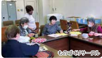
ものづくりサークル