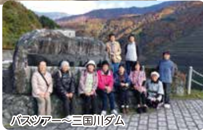
バスツアー~三国川ダム

バスツアーでは、参加者から「近所に住んでいるけど来たのは初めて」との声。さらにバスの中では自己紹介とプロの方からアルゼンチンタンゴを披露して頂き、和気あいあい楽しい一日を過ごしました。