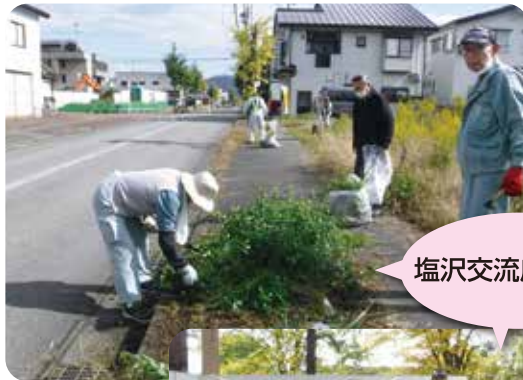
塩沢交流広場周辺