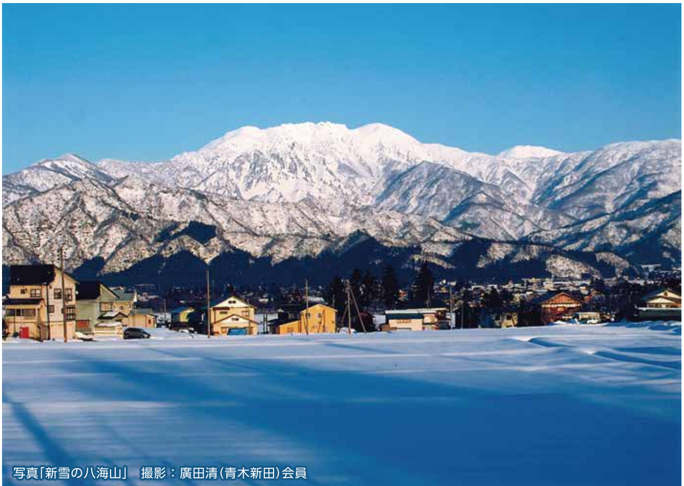
写真「新雪の八海山」