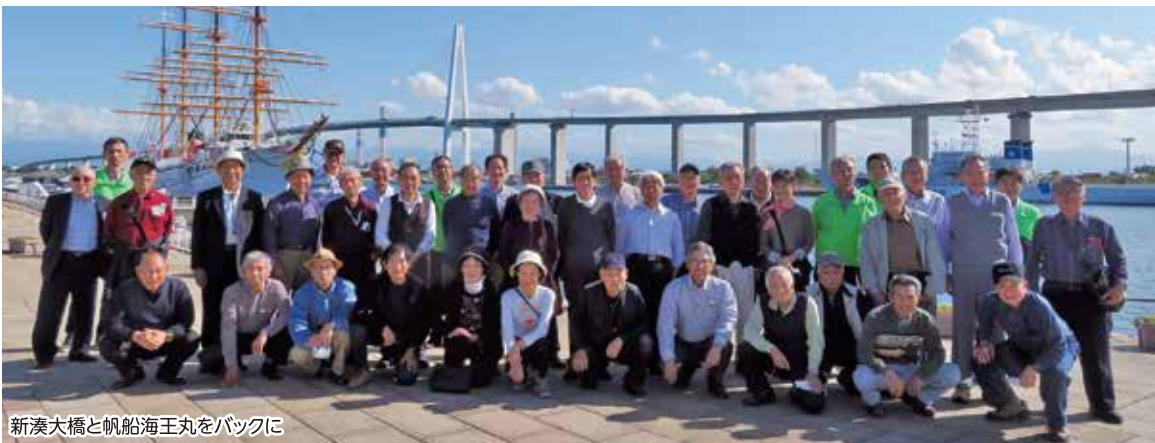
新湊大橋と帆船海王丸をバックに