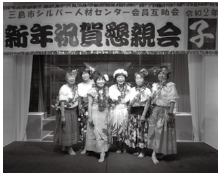
令和2年会員互助会 新年会

※「傍（はた）」とは他者のこ とです。他者の負担を軽くして あげる、楽にしてあげる、とい うのが もとも との「働 く」の 意味だ と言わ れてい ます。