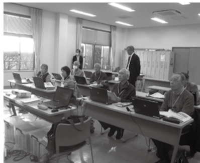
高齢者活躍人材確保育成事業「パソコン技能講習会」

と「Excel表計算」の二冊子は受講者の宝物。これさえあれば教室を出たとたんに全てを忘れてしまうような認知症まがいの小生でも、我が家のパソコンに向かえば忘れた歌を思い出すであろう。先生方、シルバー人材センター職員、受講者仲間等々、全ての方々に感謝！ 実り多き5日間であった。