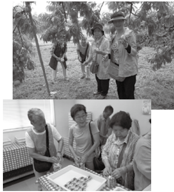
令和元年度日帰り旅行

参加費 1000円 初めての方でも、簡単にできます。道具も準備しますので、手ぶらで参加できます。 新年会のお知らせ 日時 令和3年1月14日(木) 午後6時 場所 みしまプラザホテル 参加費 3000円 たくさんの方の参加をお待ちしています。