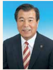
三島市長 豊岡 武士