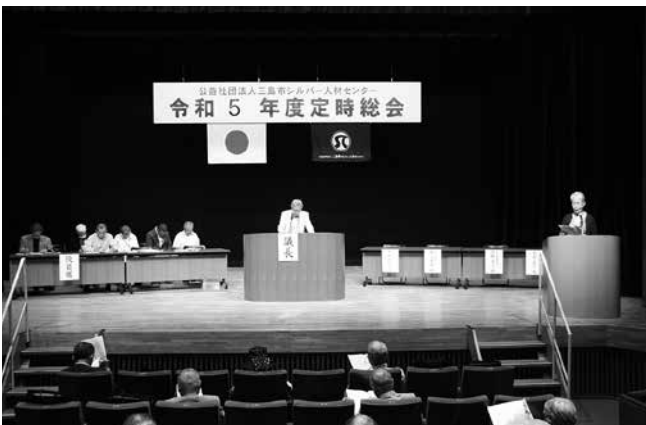
令和5年度互助会総会