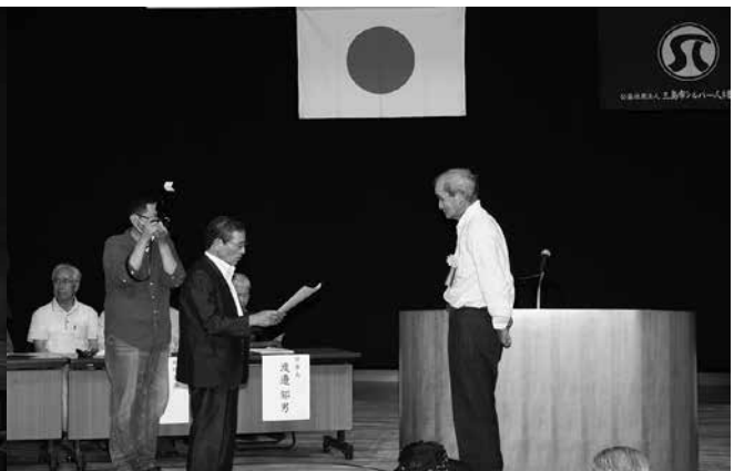
表彰を受ける廣澤会員