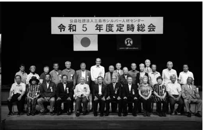
令和5年度表彰・喜寿のお祝いを受けられた方々