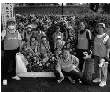
統一美化キャンペーン