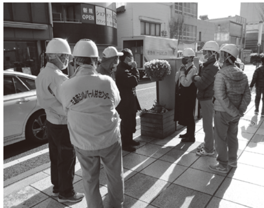
安全委員会 安全パトロールの様子

会員の皆様の職場におかれましても、今一度原点に戻り人の目・行動で安全作業を心掛けていただきたいと思えます。