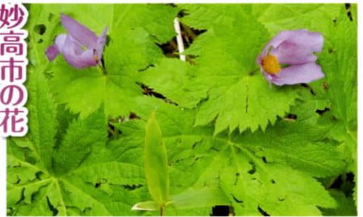
妙高市の花 シラネアオイ