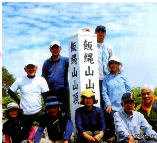
▲9月10日 飯縄山を登る