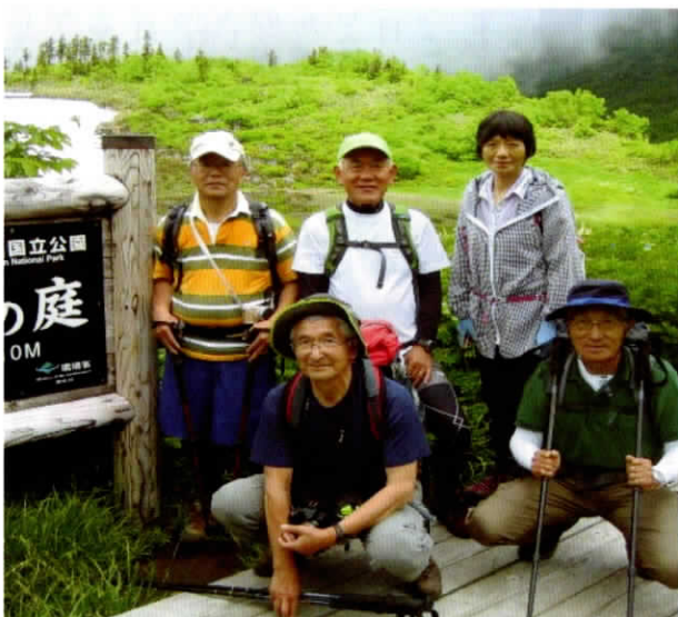
▲7月15日 天狗の庭を登る