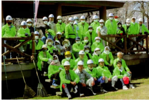
▲咲き始めたサクラの下 作業終了後、参加者全員で記念撮影