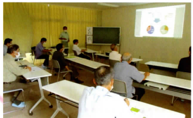
▲座学も皆さん真剣に聞いていました