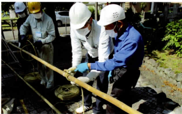
▲基本となる縄の結び方をしっかりと習得

経塚山公園の観桜会を前に毎年恒例になっている清掃ボランティアを昨年4月7日晴天の下36名が参加しました。参加者は、熱心に折れた枝や落ち葉などの処理に汗を流しました。 また、新井別院内清掃ボランティアに10月29日14名が参加しました。新井別院さんからは、「きれいにしていただき有難うございました」と御礼の言葉をいただきました。