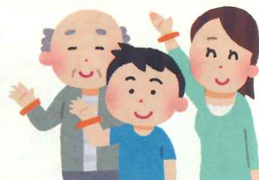
オレンジリングは 認知症サポーターの証