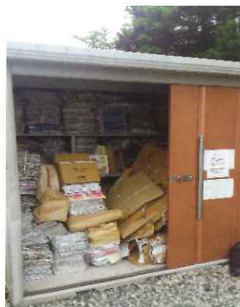
事務所前の保管庫

古紙等（新聞紙・雑誌・ダンボール・その他雑紙）の回収をしています。事務所前に保管庫を設置していますのでご協力をお願いします。那珂川町古紙回収補助制度による収益金は、会員の組織活動資金として活用します。