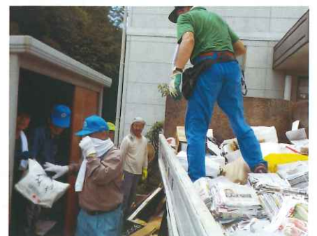
トラックへの積み込みの様子