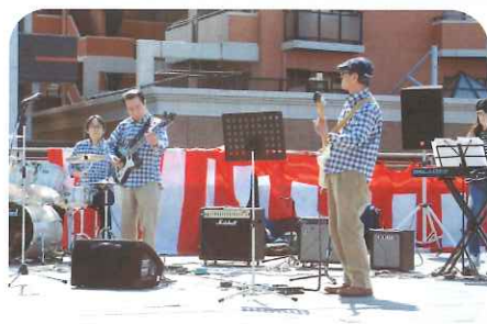
ザ・ブルーレイズ

当日は、晴天に恵まれ、ステージや販売ブース、そば打ちの無料体験・試食コーナーでは開始直後から、お子様連れの家族など、多くの来場者で賑わい、今年も町内外に向け当センターの事業等についてPRを行うことができました。