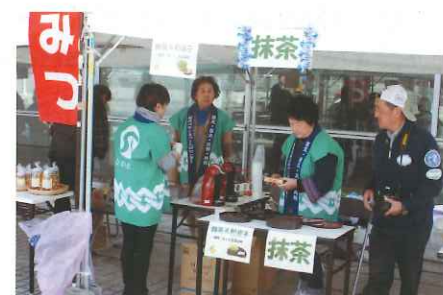
抹茶と和菓子販売