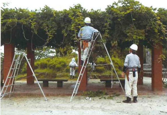
安全パトロールの様子（剪定現場）

当センターでは安全就業委員会を中心に日々、会員の安全対策への取り組み方や就業現場への安全パトロールを実施し、安全保護具着用の指導などを行っております。