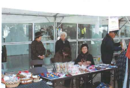
手づくりグループ「和み」