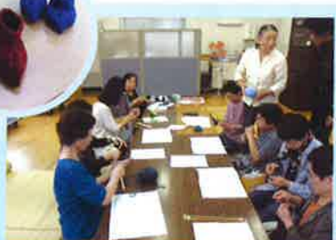
村岡会員の指導による「編物講習」手芸サークル等企画中です。