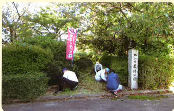
10月14日 北山田地区（北山田農村公園）