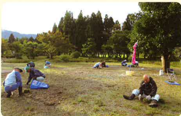
10月13日 井波高瀬地区（高瀬遺跡公園）