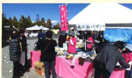
「いらっしゃい、あいよ!!」 南砺菊まつり会場にて