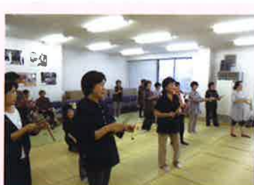
野原会員の指導のもと「利賀のこきりこ踊り」