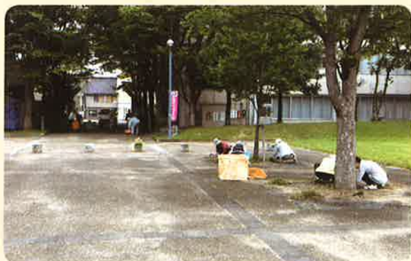
10月6日 福光地区（福光公園）