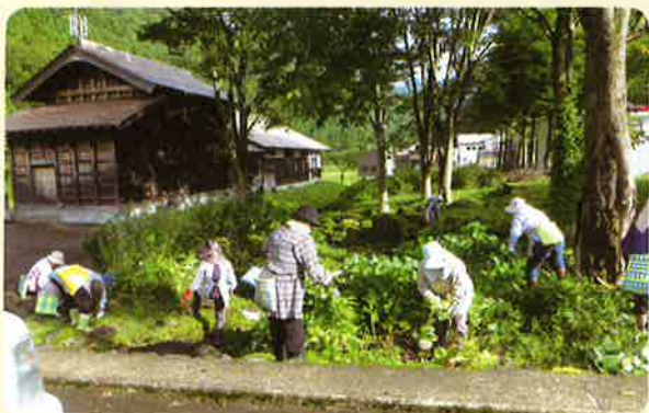
9月17日 利賀地域（利賀そばの郷広場）