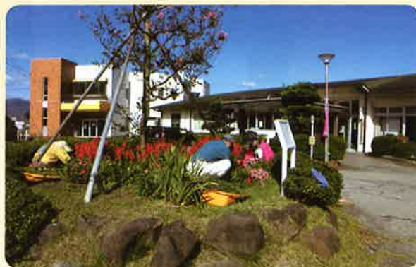
10月13日 北野地区（美山荘）