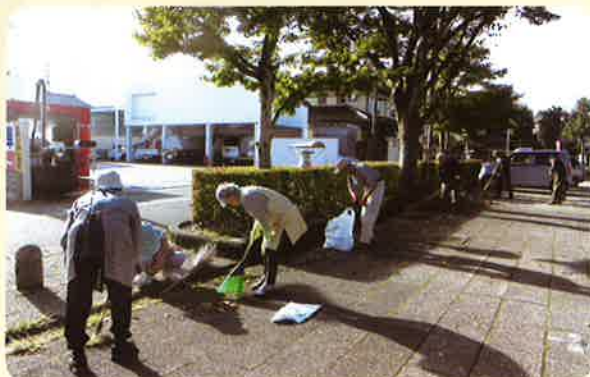
10月13日 野尻地区（ヘリオス周辺）