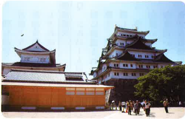
(6月復元完了予定の名古屋城本丸御殿)