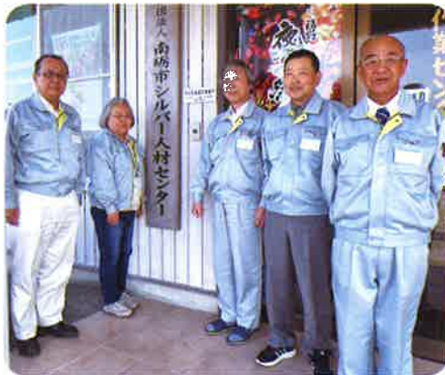
(推進員・運営員のみなさん)