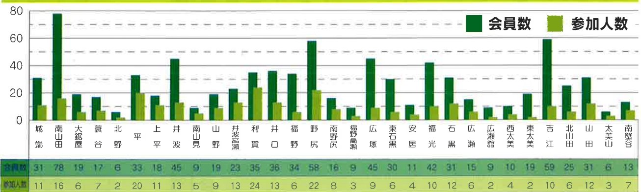
平成 29 年度 各地区懇談会参加人数

A 店舗での販売に向け準備を進めています。水はけも良く、虫もあまり寄ってこない土壌改良材です。昨年の菊まつりには、女性部がシルバーのPRと堆肥販売を行い完売しました。