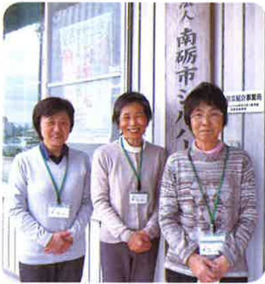
(臨時職員のみなさん)