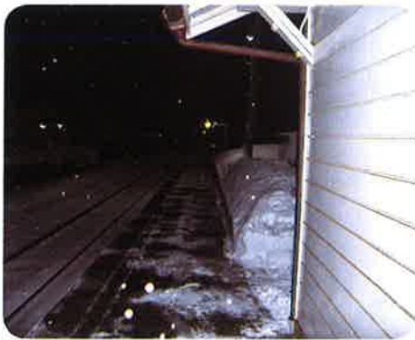
(スッキリときれいになったホーム)

A 今年の経験を想定内としてとらえられるよう、また通勤・通学の皆さんが安心して乗降できる除雪作業を続けていきたいと思っています。