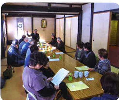
(H30.2.20 利賀地区 懇談会)

Q 独自講習会が会員限定ではなく、一般の方も対象にすれば会員も知人を誘いやすくなるし、会員拡大に繋がると思う。