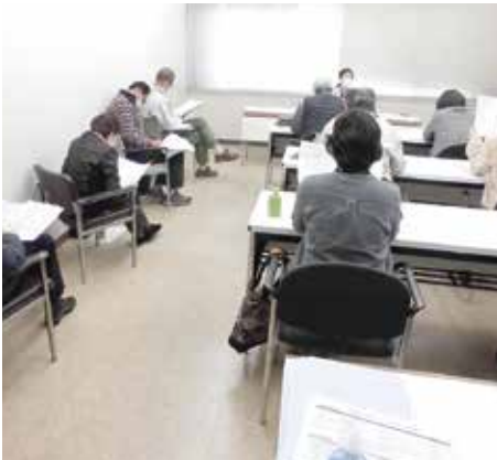
昨年の出前入会説明会(城端市民センター)