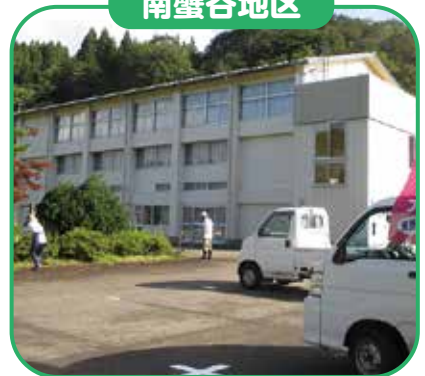
10月3日(日) 西太美交流センター