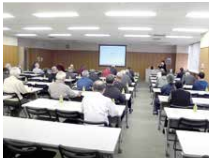
令和3年度は全地区班長、職群班・就業班長を対象に「マナー研修会」を開催しました。