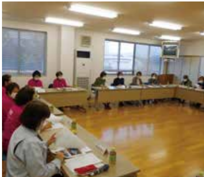
予定時間を超え意見交換がなされました。

十一月八日には、視察のため来所された富山市シルバー人材センターの役員十七名と当センターの女性部役員が、女性部の活動について意見を交換しました。