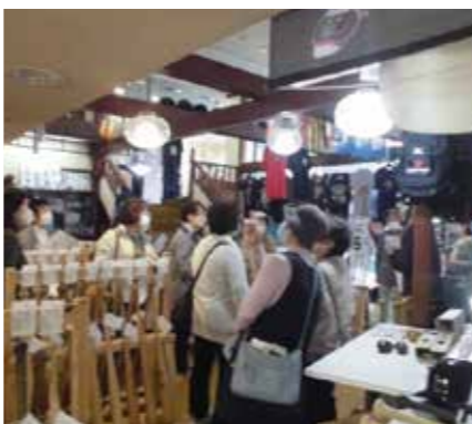
バットミュージアムを見学中