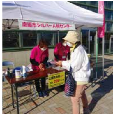
土壌改良材も完売しました。

さる十一月三日（木）女性部の役員が、南砺菊まつりにてシルバーのPR活動を行いました。