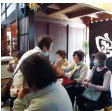
石黒種麴店でおいしい甘酒を頂きました。

参加者は、約三時間福光地域の名所をめぐり、会員同士の交流を深めながら、福光のまちなみを満喫しました。