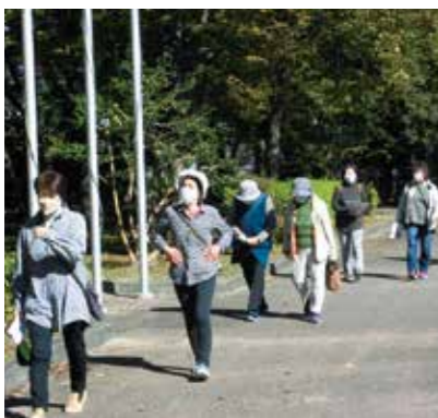
女性部の集いは、毎年天気良好です。（松村記念館）