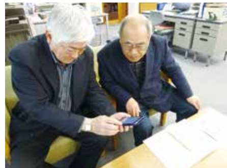
デジタル機器について相談ください!!

会員の皆さんからスマホの使い方などをよく尋ねられる。ちょっとした困りごとの解決のお手伝いならできると思い応募しました。