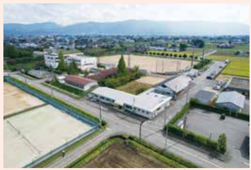
シルバー事務所上空写真

ドローンによる空き家・空き地等管理サービスのオプションサービスを開始します。 (事業開始予定…令和五年六月頃)