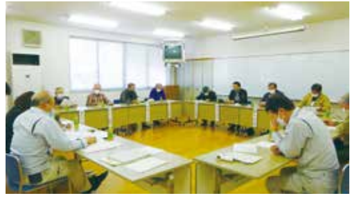
3月10日、保育園管理業務の就業会員を対象にした説明会を南砺市役所こども課の担当者同席のもと開催しました。

事務局では、契約締結に向けて業務内容を点検し、適正な契約となるよう努めています。 点検の結果、これまでの請負契約から派遣契約へ切り替えとなる業務があるため、会員の皆様の就業形態も変更になる場合があります。例えば、会社内での軽作業や施設管理業務が該当し、派遣会員は、労働者派遣法、労働基準法等の法律が適用される点が、請負会員との違いとなります。 (下記参照)