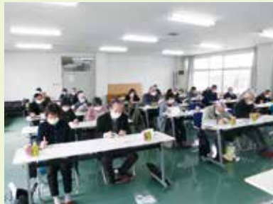
▲2月11日 城端地域合同