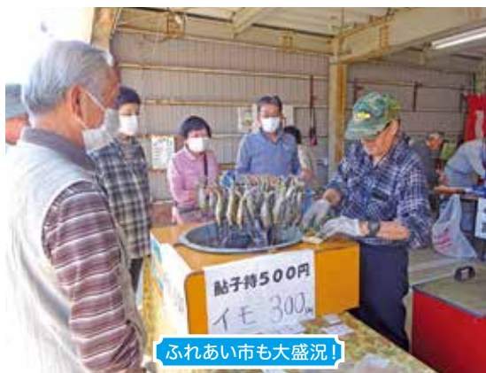
ふれあい市も大盛況!