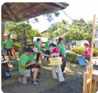
8/26 井波木彫刻キャンプ会場