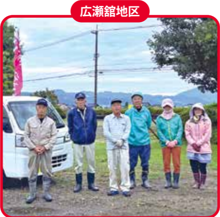
10月4日(水) 広瀬館農村公園