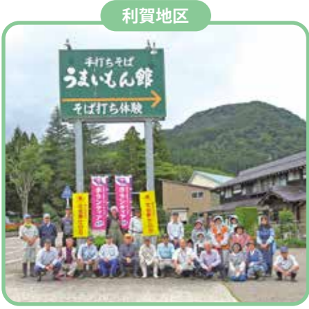
9月18日(月) 利賀そばの郷

各地区で奉仕活動を実施しました。十月のシルバー人材センター「事業普及啓発促進月間」にあわせて、公共施設の清掃奉仕活動をおこないました。この活動には二〇名の会員が参加し、地域の環境美化に務めました。皆さん、お疲れ様でした。