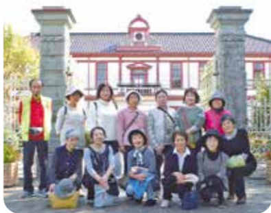
巖浄閣…国指定重要文化財 旧富山県立農学校本館

参加者は、約三時間福野地域の名所をめぐり、会員同士の交流を深めながら、まちなみを満喫しました。