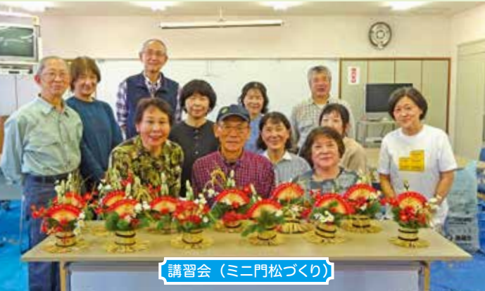
講習会（ミニ門松づくり）