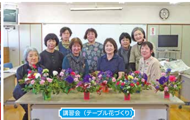
講習会（テーブル花づくり）