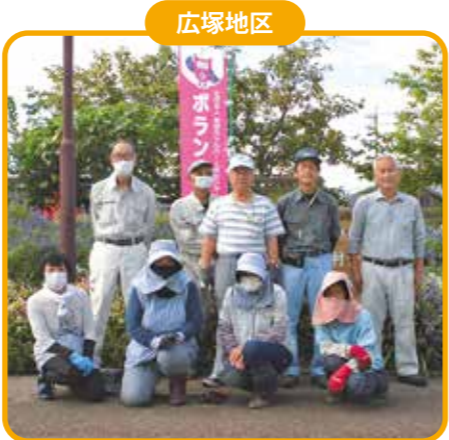
9月30日(土) 南部交流センター