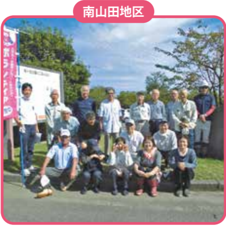
9月30日(土) 桜ヶ池公園