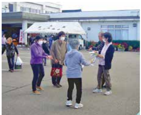
「私たちの仲間になりませんか? ご入会お待ちしております。」

東太美地区では、班員四名が十月八日の地区の文化祭の会場で独自の会員募集の活動を行いました。地区で独自のPR活動等をされる場合は、事前に事務局に連絡くださいますようお願いいたします。