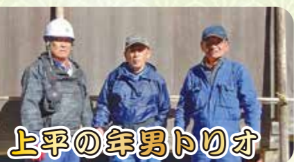
上平の年男とりお