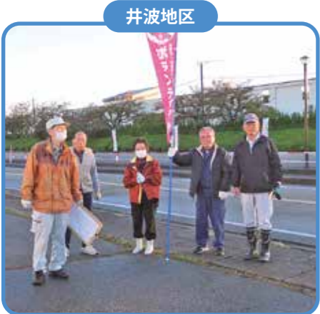
10月22日(日) 井波文化センター