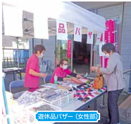
遊休品バザー（女性部）