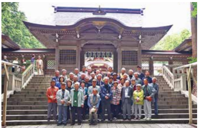
越後一宮 弥彦神社にて

境内は鬱蒼たる樹林に覆われ、亭々たる老杉と古樫は神々しく、神殿に「健康で幸せと旅の安全」を祈願しました。