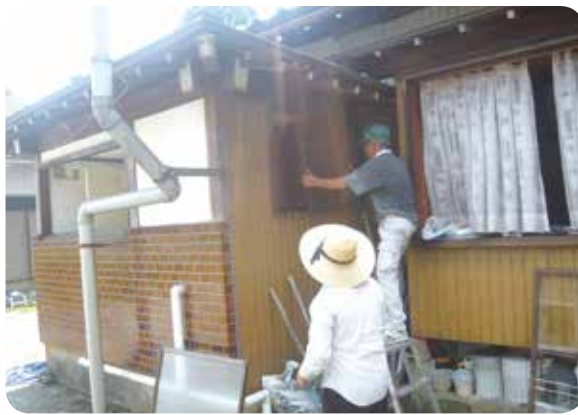
窓ガラス・網戸の掃除中

散居村を守るには、「空き家」「空き地」の庭木の剪定や雑草の刈り取り、木々の病害虫発生抑制などの環境づくりが必要です。また、シルバーでは、エコ活動として、庭木の剪定や伐採で出る木屑や枝葉の「チップ化」と落ち葉を集積し腐葉土とすることを実施しています。これらは花壇や畑の土壌改良材や果樹園の抑草チップ材として利用できます。