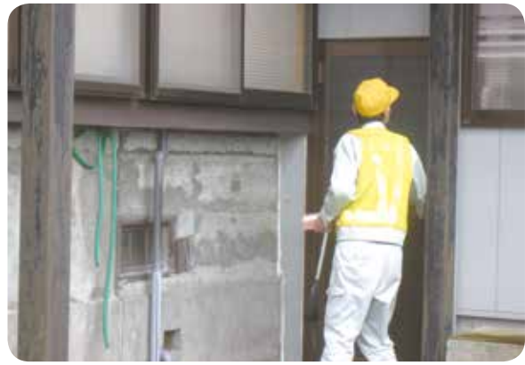
週1回建物の外観の見回りや郵便物の確認を行っている