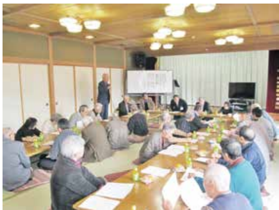
(城端・南山田地区懇談会 H28.2.13)

A 堆肥事業の拡大により、就業機会が増え、堆肥収入にもなると考えているが、利用者が不利になつては困る。ただし、運搬代は利用者持ちになるのでその辺は良く考えていきたい。