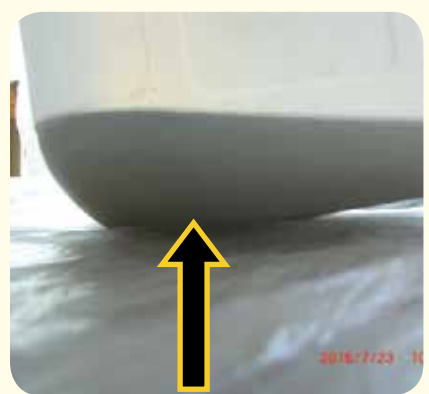
③洗浄後の汚水がポリタンクにたまって黒く濁っています