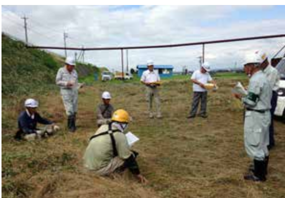
第1回安全パトロールの様子 (7月7日 福光地内)

対象物をしっかり見定め、目と耳で確認し、はっきりとした声で「○○ヨシ!」と呼称します。皆さん、人間のエラーによる事故を防ぎましょう。