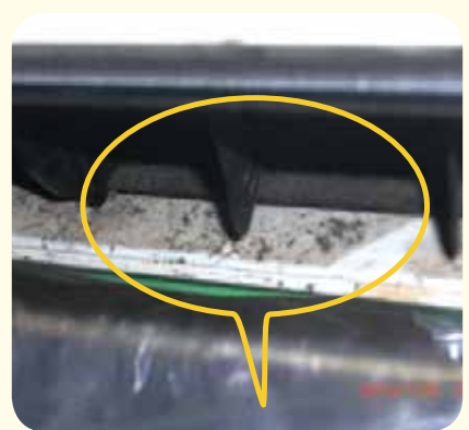
②洗浄液をかけて洗うとカビホコリ等が流れ落ちる