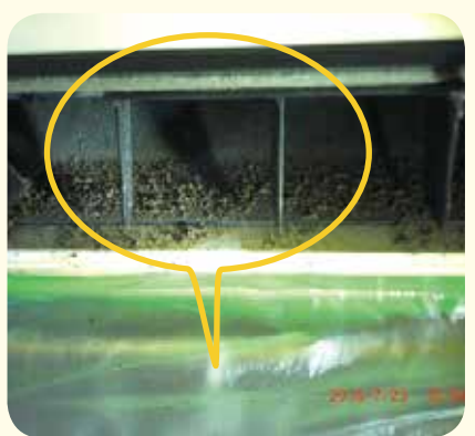
①モーターファンをブラシでこするとカビ、ホコリ、たばこのヤニ等が落ちます