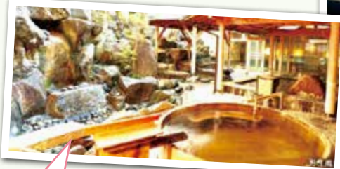
「舌切り雀」の伝説が生まれた地として 知られる磯部温泉 温泉は「美肌湯」「風邪治しの湯」