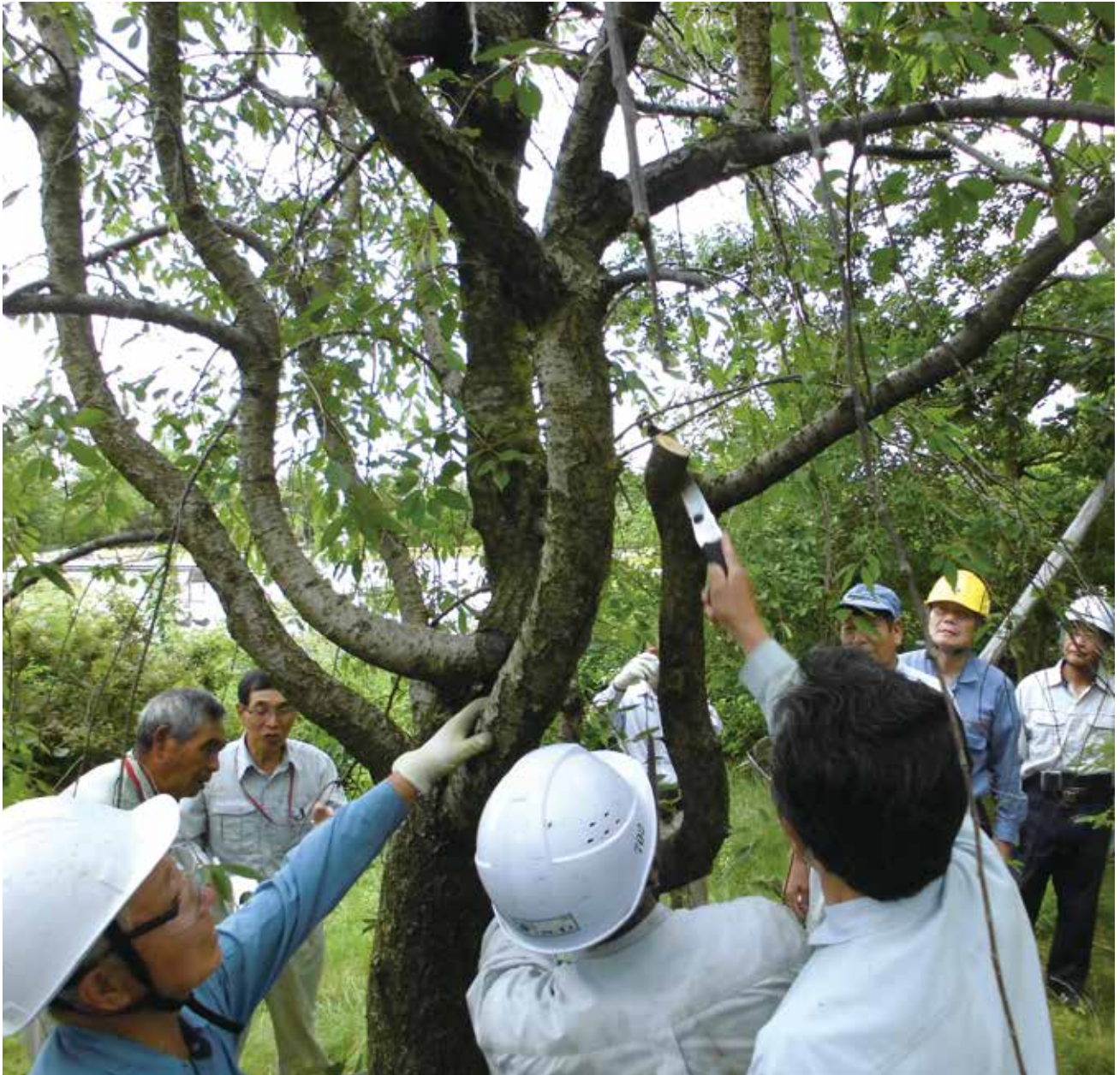
剪定講習会（南砺市園芸植物園）