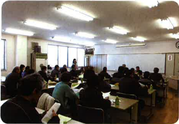
(地区活動班：入会説明会にてPR中!!)