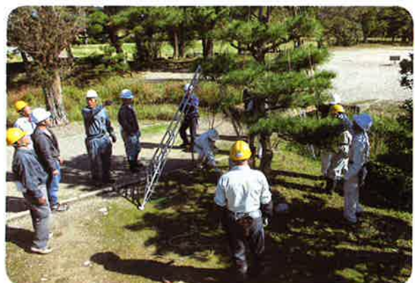
(講習会担当：講習会を企画・開催します)