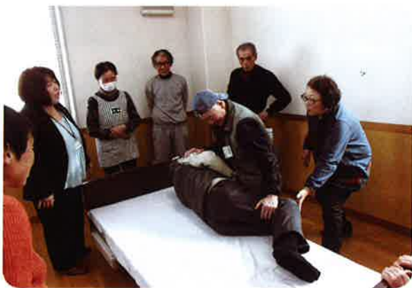
(介護補助・接遇マナー講習会)