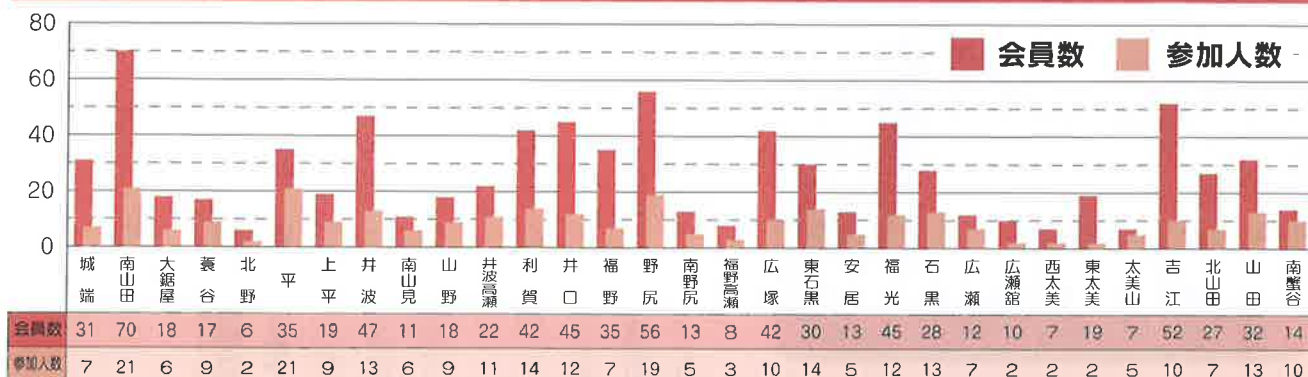
平成 28 年度地区懇談会参加人数

A 今回、会員研修のアンケー トを全会員にお願いし、その 結果を総務委員会により参加 しやすい研修となるように検 討していきます。