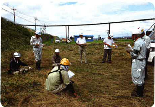
(安全担当：パトロール中です)