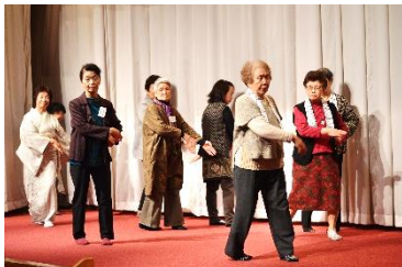
前田音頭をステージで