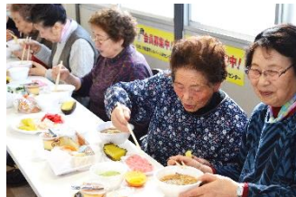
漬け物もおいしい!