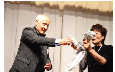
助手もにっこり・マジック!