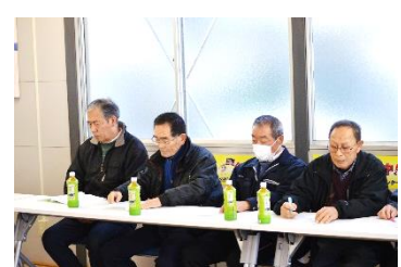
大船渡北・赤崎班