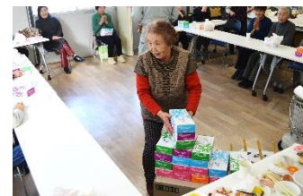
ティッシュ 3 箱ゲット