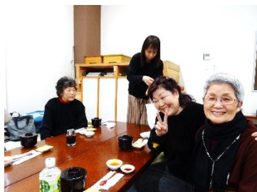
これからお風呂です。