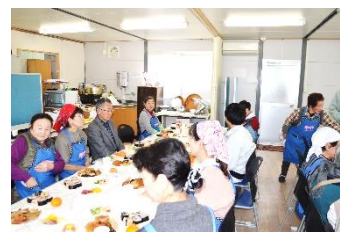
いよいよ、懇親会です