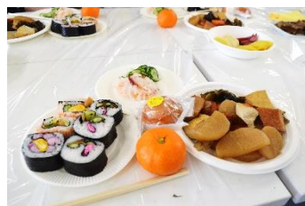
本日のメニューです