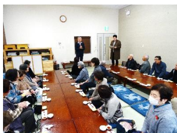
理事長からの挨拶

2月26日にカルチャースクール（日帰り親睦旅行・芝居鑑賞）を実施しました。参加者は29人で、行先は北上市の「まーす北上」でお風呂に浸かり食事をして、その後芝居を楽しく見て帰りました。