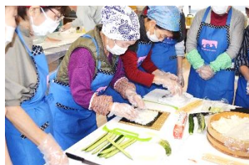
のり巻きの基本です

女性会員がみんなで集まり作るのは、生きがいの充実にもつながり、今後、このような活動を実施し、健康、笑顔で生き生きとしたセンター活動ができるよう取り組んでいきたいと思ひます。