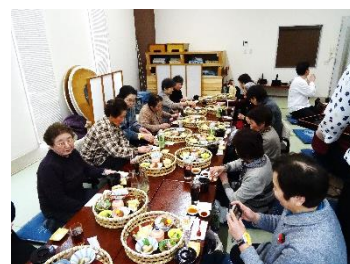
竹かごの昼食です