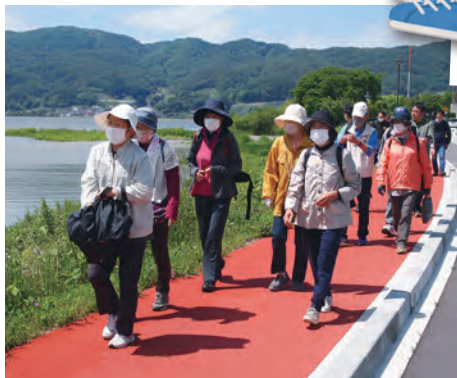
湖畔をウォーキング後、下諏訪町健康フィールドでTRXを体験