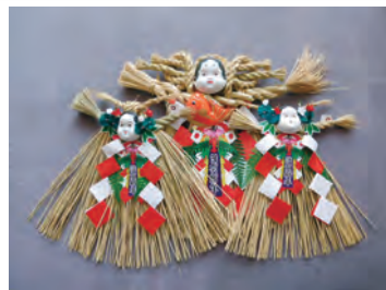
▲会員製作の注連飾り

作業はフリータイム制であり、都合の付く曜日、時間の参加で構いません。手作業の好きな方の参加をお待ちしております。