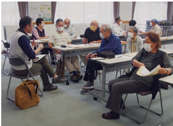
▲理事と地域班長が懇談

地域班会議もコロナの影響で3年間中止となっていたことから、班長から積極的に質問が出されました。