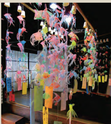
涼し気なりボン金魚