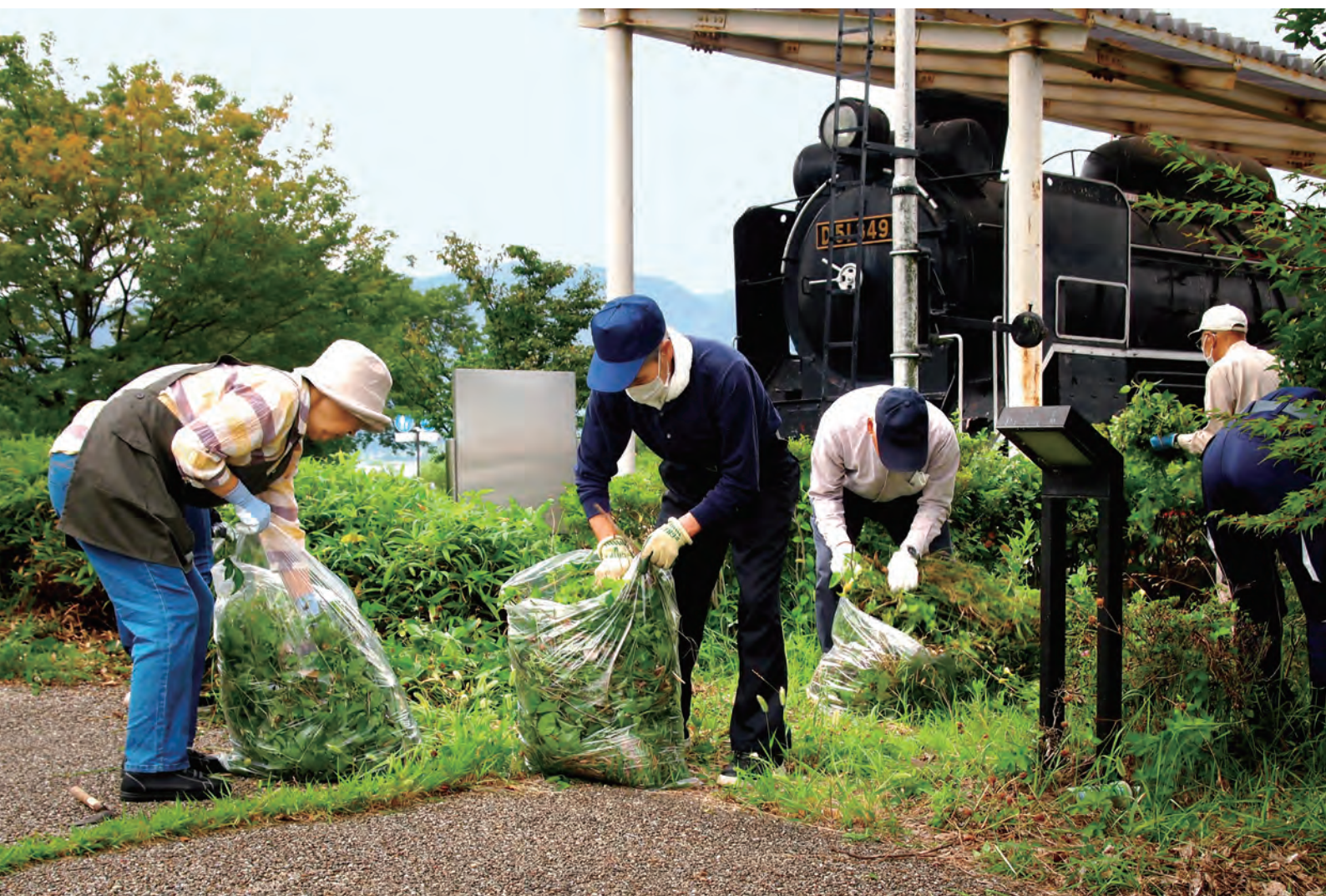
令和5年7月 社会奉仕活動（諏訪湖ハイツ）