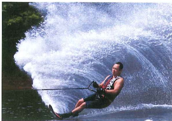
加東市内水上スキー