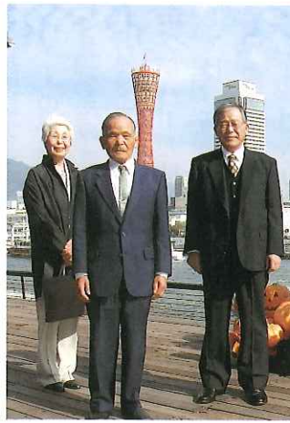
当日出席者集合写真