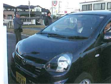
自動衝突回避装置を装着した車での運転を会員が体験。チョット怖い瞬間?