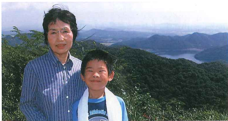
見晴らしが良いぞ!

祀つてある険しい近道を避け緩やかなコースへ、残り400米で一休み。登山口から一時間で山頂に着き、そこは海拔271米、360度見渡せる中道子山、通称志方の城山跡です。案内板によると、室町時代に赤松一族が築き約170年間続いた東播磨で有数な山城で今も土塁が残っている。四脚門の大手門、本丸、二の丸、三の丸を有したその栄華が忍ばれます。