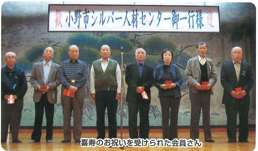
喜寿のお祝いを受けられた会員さん