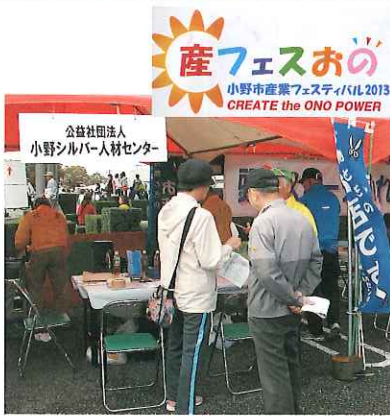
産業フェスティバル

仕上げは「何万丁も仕上げた」のベテランが、刃先を見ながら小さいハンマーで何回も刃を叩いての咬み合わせの調整です。新品同様になりました。 10月19・20日に開催された産業フェスティバルにもブースを出されました。次ぎ次ぎと包丁や剪定鋏を研ぎに持ってこられました。