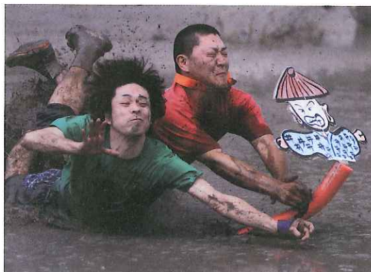
篠山大国寺お茶祭り大田動会

京都宮津市の出船祭り、東北大祭りも撮った。他にも撮りたい祭りはたくさんあるが、特に神楽が撮りたいが機会に恵まれない。これらの中から各コンテストに出品しているが時々入賞している。