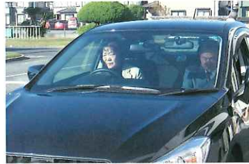
19名の会員が実技にチャレンジ