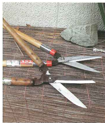
新品同様になった刈込鋏

仕上げは「何万丁も仕上げた」のベテランが、刃先を見ながら小さいハンマーで何回も刃を叩いての咬み合わせの調整です。新品同様になりました。 10月19・20日に開催された産業フェスティバルにもブースを出されました。次ぎ次ぎと包丁や剪定鋏を研ぎに持ってこられました。