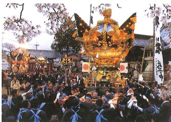
加西市「北条節句祭り」