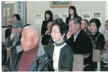
熱心に受講される会員

平成25年11月21日小野交通安全協会と小野自動車教習所で交通安全講習会が開催され、34名の会員が参加されました。