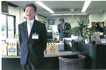
中村市民安全部長からシルバーへ激励の言葉