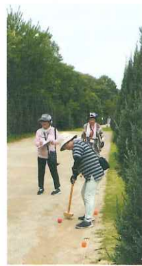
(取材：鈴木広報委員)