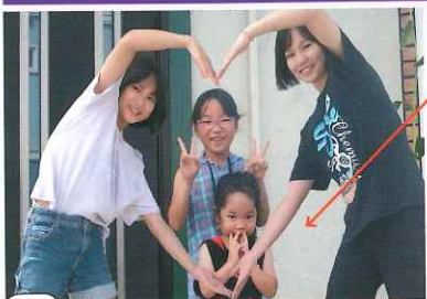
ご機嫌ななめのサエちゃん