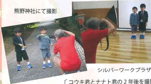
熊野神社にて撮影