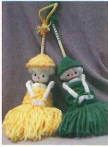
～人形のはたき～ テレビの前も ササツときれいに

「布あそび」は手芸大好きな女性会員たちが集まっておしゃべりしながら各々好きな作品を作っています。今はマクラメ編みがブームで、得意な会員から教わりながらハンギングバスケット入れを作っています。メンバー全員が先生であり生徒なのです。シルバーで就業し、余暇を会員同士ふれあって見聞を広めています。現在メンバーも14人になり月2回の集まりが楽しみです。