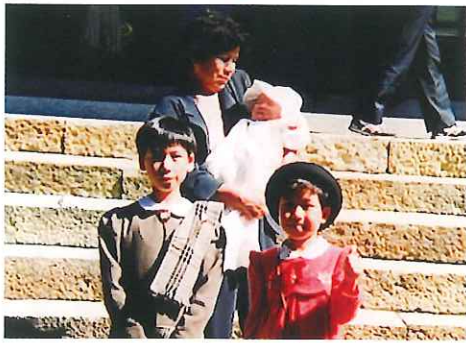
お孫さん(三女) お宮参り