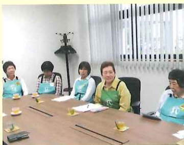
インタビューに答える会員さん

毎日遊んでいるのも勿体無い気がしてシルバーに登録。就業してまだ1ヶ月ちょっと。仕事を覚えるのに毎日緊張。趣味は芸能観賞・コンサート・スポーツ・散歩。コーラスをやっている。健康に気を付けて頑張りたい。