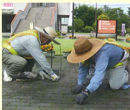
タイルの目地の草を取る作業

平成16年の入会で最初はひまわりの丘公園で就業。此処は平成20年4月からで、最古参です。引継ぎの準備をしている。芝生の散水の時期は、ホースの長さや散水栓の場所を考えて作業する。春は桜・秋は落ち葉が広範囲に散らばり清掃はとでも大変。余暇はゲートボールを楽しんでいます。