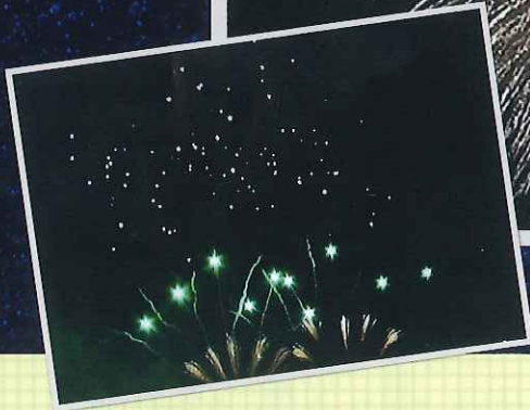
小野まつりの花火