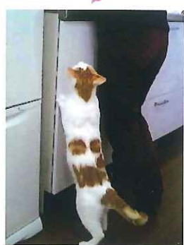
おねだりするグレ

この時は知りませんでした。お昼ごはんのおかずが魚があつたので前に置くと、「食べなよ！」と言う間もなくペロリと平らげてしまいました。「もう無いよ！」と言っても私にじゃれついてきます。