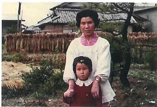
土肥さんと娘さん(3姉妹のお母さん)との写真

あつと言う間の20年でした。入会時に産まれた孫も、成人式を迎え、二重の喜びです。健康で仕事を続けられた事に感謝しています。