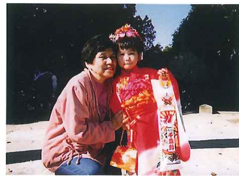
お孫さん(三女)の七五三

あつと言う間の20年でした。入会時に産まれた孫も、成人式を迎え、二重の喜びです。健康で仕事を続けられた事に感謝しています。