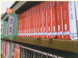
吉川英治さんの大ファン