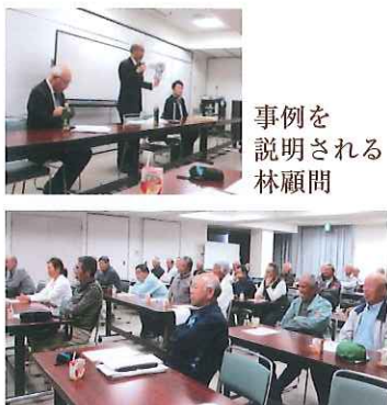
講習会に参加の皆さん