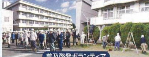
普及啓発ボランティア