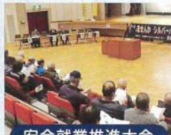
安全就業推進大会