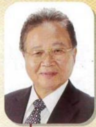
大郷町長 田中 学