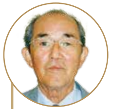
一般社団法人 大郷町シルバー人材センター 理事長