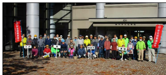
Zホールでの奉仕活動