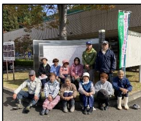
胆沢文化創造センター