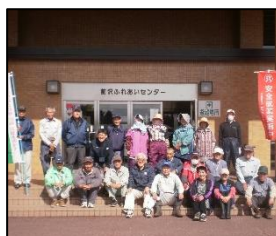
前沢ふれあいセンター