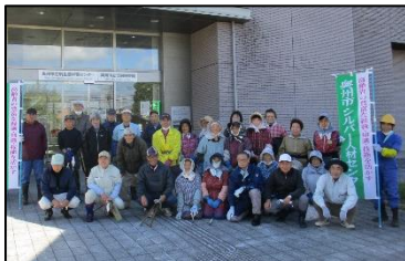
江刺生涯学習センター