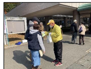
いさわ商工秋まつりにて