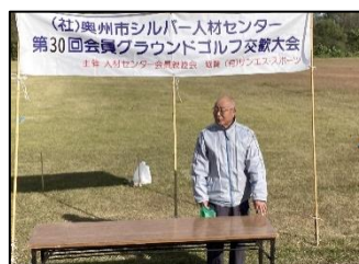
挨拶する熊本会長