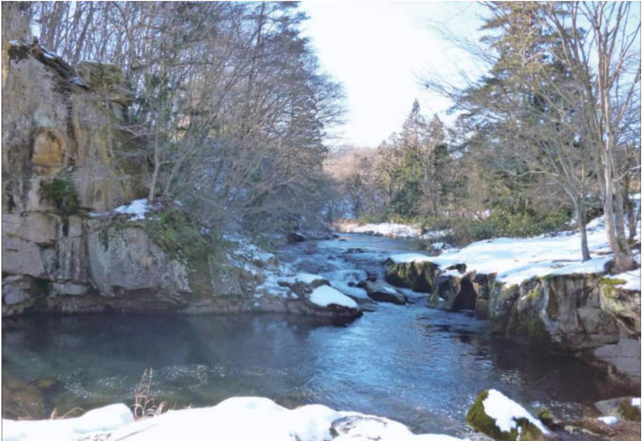
衣川 菊の滝