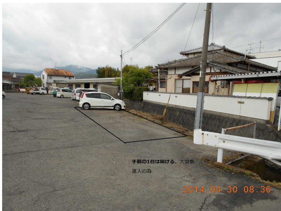
手前の1台は開ける。大型車 進入の為

5月より、駐車場を農機センターの一部をお借りするようになりました。お間違え無いようにお願いします。