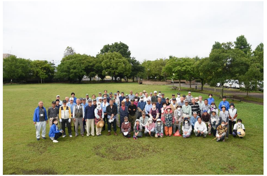
(↑奉仕作業前の集合写真、事務所に飾っています。)

※奉仕作業終了後には、互助会主催のグラウンドゴルフ大会で楽しいひとときを過ごしました。