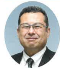
西条市長 玉井 敏久