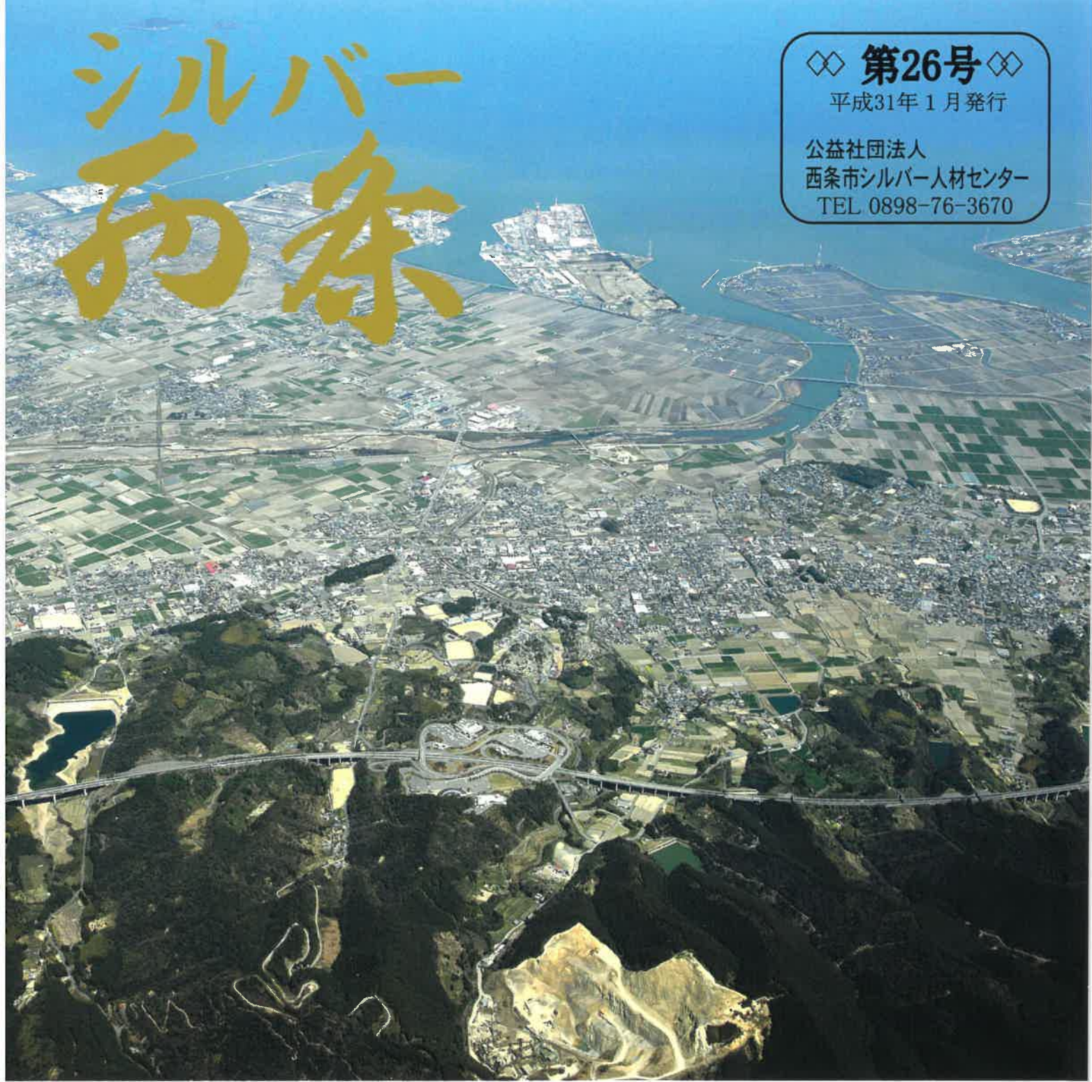
空から見た西条市