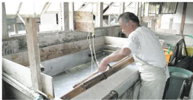
周桑手すき和紙職人