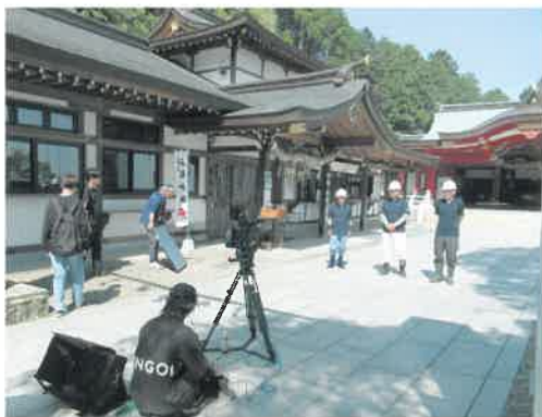
6月からテレビで放送されているシルバーのCMに、当センターの会員も出演しました。このCMは愛媛県シルバー人材センター連合会のHPでもご覧いただけます。