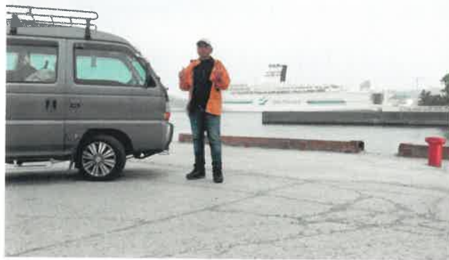
小樽フェリーターミナル新日本海フェリー「はまなす」とホンダストリート(H7)四駆車

山形県東根市へ移動し、生産日本 一のサクランボ農園を案内してもら う。広大な敷地のパイプハウスでは 直径50cmを超える幹が目を引く。佐 藤錦、紅ほのか等数種類を栽培して いた。さくらんぼは、霜、雨、温度、 害鳥に弱く、品質管理を徹底しなく ていけない。収穫までの手間を考え れば市場の高値は当然だと思えた。