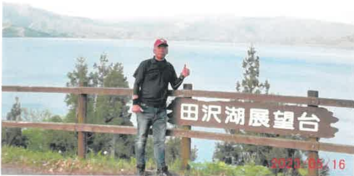
秋田県 田沢湖にて

みちのく一人旅を再開した。前回 は空と鉄道の旅だったが、今回は、 車で日本海を北上しながら、世界文 化遺産や絶景ポイントを観て回る事 にした。連休明けでの出発だったの で、観光地は静寂感に包まれている。