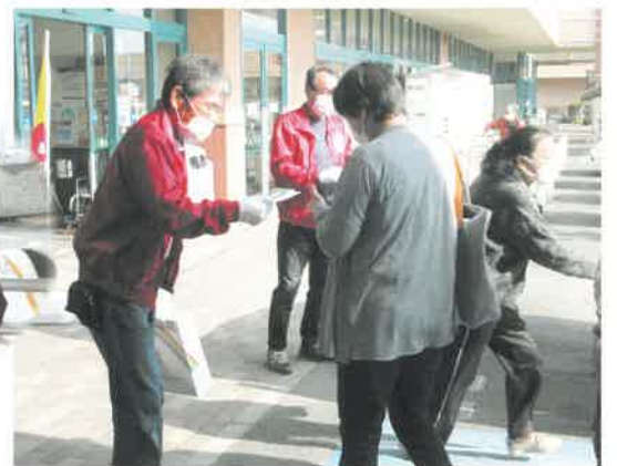
西条地区と東予地区のスーパーで普及啓発のチラシとティッシュを配りました。