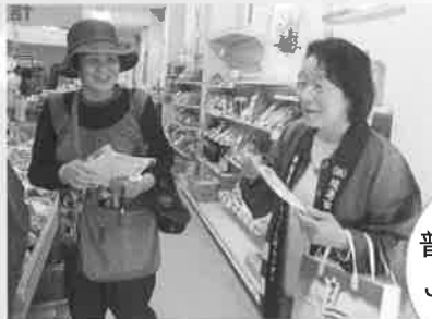
普及啓発活動 JAまつりにて