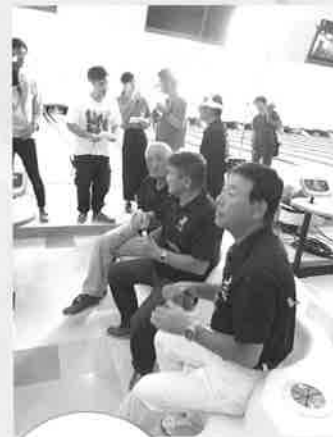
中海テレビ放送 ボウリング 決戦