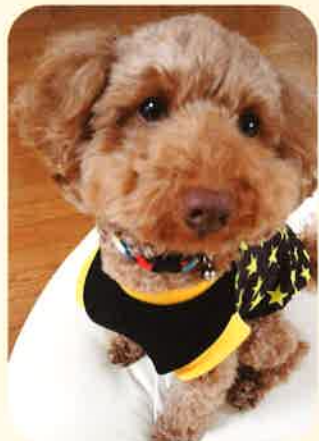
小川メンディー (トイプードル・3才)